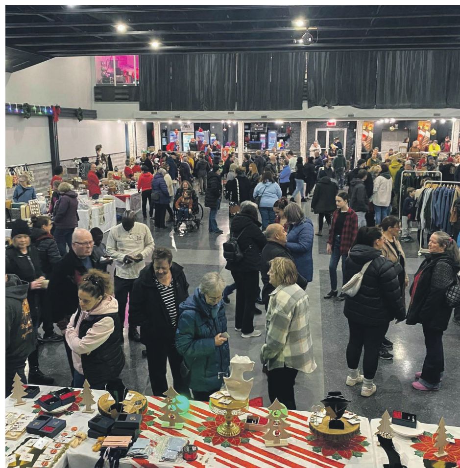
Le Marché de Noël en sera à une huitième édition les 22 et 23 novembre.

Les heures seront de 18 h à 21 h le 27 novembre, de 13 h à 21 h le lendemain, de 10 h à 17 h le 29 novembre et de 10 h à 16 h pour la dernière journée.