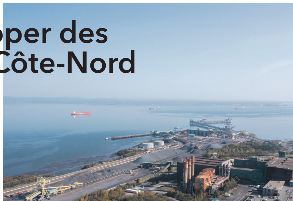
Les installations de la Société portuaire et ferroviaire de Pointe-Noire.

Le potentiel de la Fosse du Labrador en matière de fer, mais aussi de minéraux critiques et de terres rares est souligné par le gouvernement.