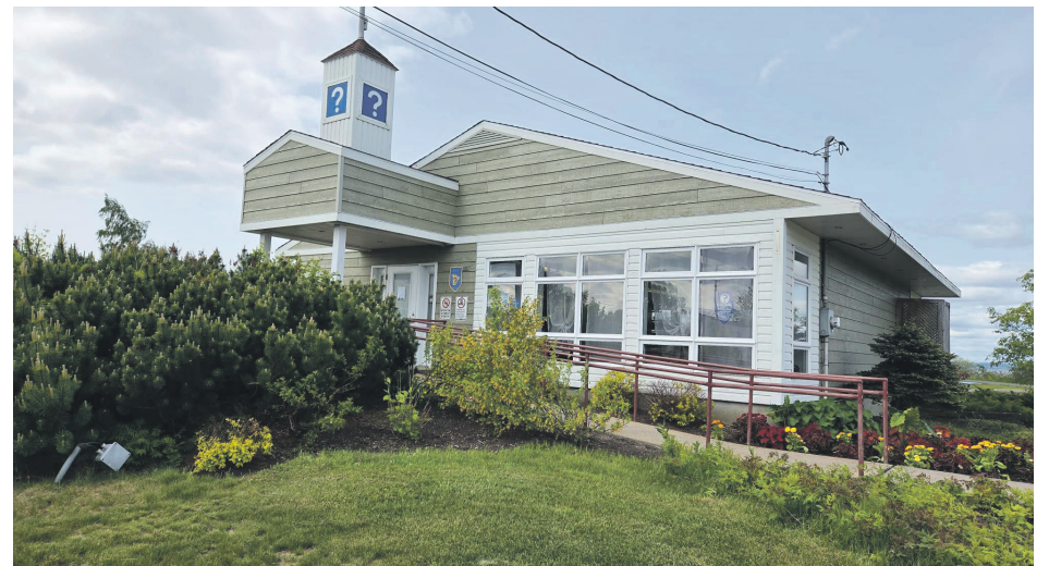
La Maison du Tourisme constitue une installation essentielle pour les voyageurs désirant découvrir Sept-Îles.

«Au final, la fréquentation du lac des Rapides pour la saison 2025 confirme l'intérêt soutenu du public pour la