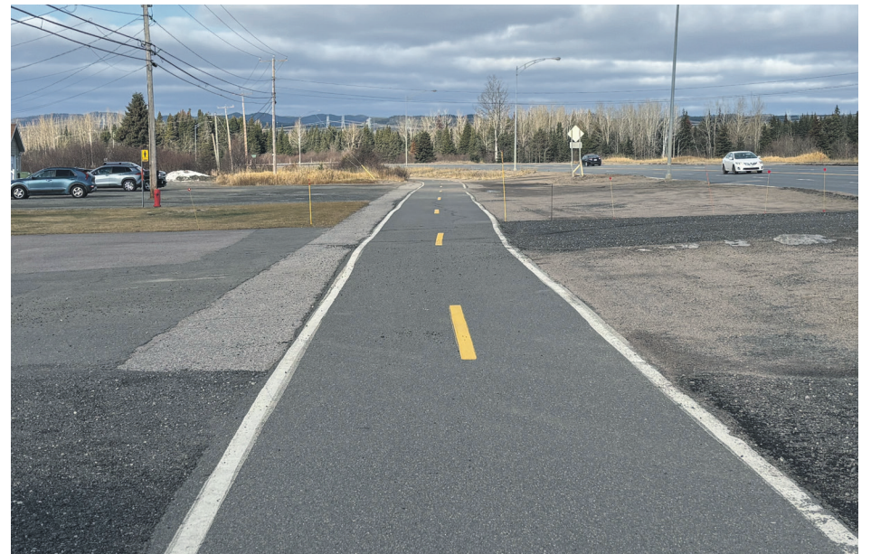
Pour un premier hiver, la Ville de Sept-Îles fera l'entretien de la piste cyclable menant de la Maison du tourisme au parc Ferland.

Comme plusieurs personnes n'ont pas accès à une voiture et qu'ils n'ont d'autres choix que de se déplacer