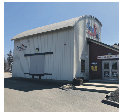
Le Café-théâtre Graffiti est en activité depuis 1984, à Port-Cartier.

En plus de l'agrandissement, une mise aux normes du bâtiment qui a célébré ses 40 ans en 2024 sera effectuée. Il y aura notamment des améliorations aux systèmes de ventilation et à la toiture.