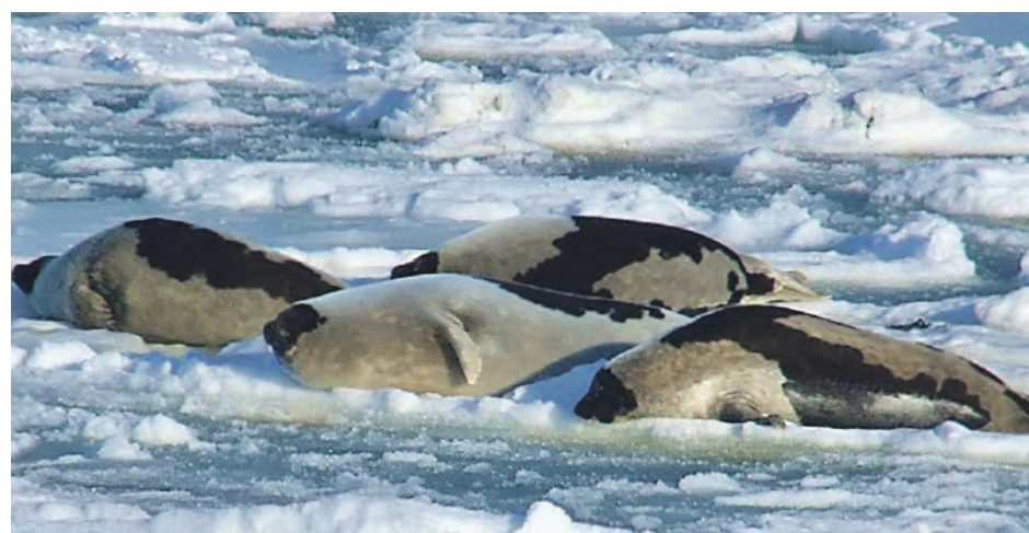
Les populations de phoques sont abondantes dans l'est du Canada.