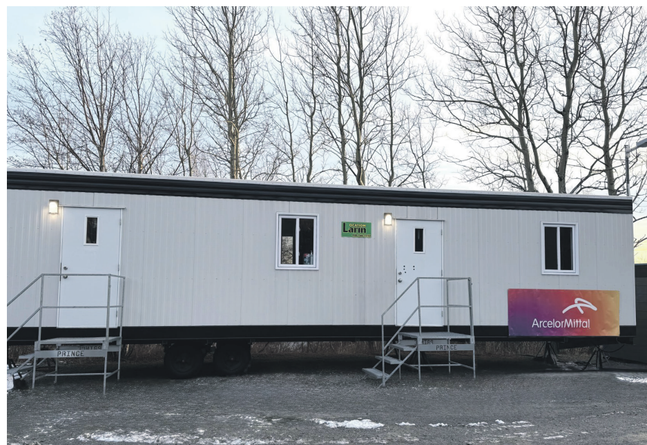
Située sur l'île Patterson, à proximité du camping municipal Le Patterson, la halte-chaaleur peut accueillir jusqu'à dix personnes par nuit.

«En appuyant ce projet, nous soutenons non seulement répondre