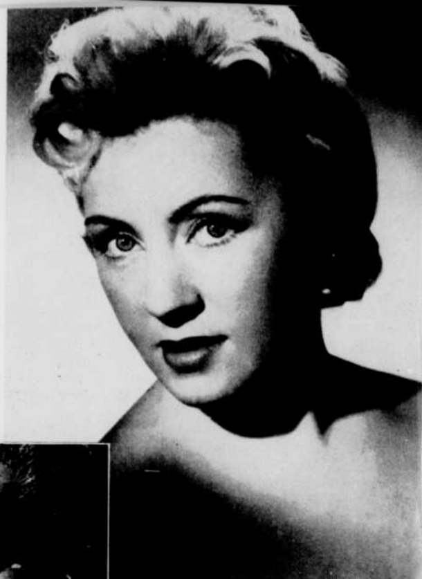
Pierrette Alarie (Constance)

Pedrillo et Belmonte échafaudent un beau projet d'évasion, malheureusement vite éventé. Conduits devant le pacha, les coupables s'attendent à être traités avec la dernière rigueur.