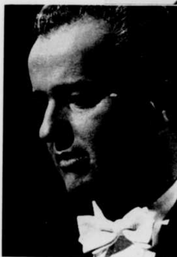
Léopold Simoneau (Belmonte)

Par chance, ils voient leur sort bientôt changé en félicité... comme il fallait s'y attendre dans une opérette, même si elle est de Mozart.