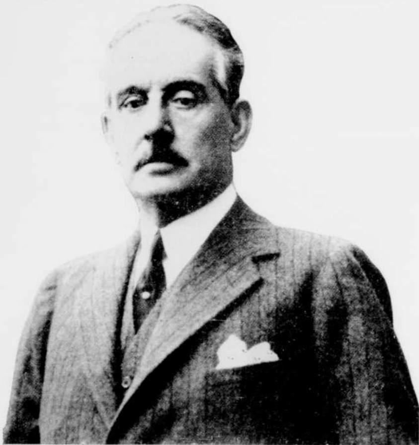
GIACOMO PUCCINI sera en vedette à Théâtre d'opéra à la chaîne FM de Radio-Canada, le samedi 20 août de 1 heure à 4 heures, alors qu'on présentera trois des oeuvres de l'auteur de la Bohème: Il Tabarro, Suor Angelica et Gianni Schicchi.