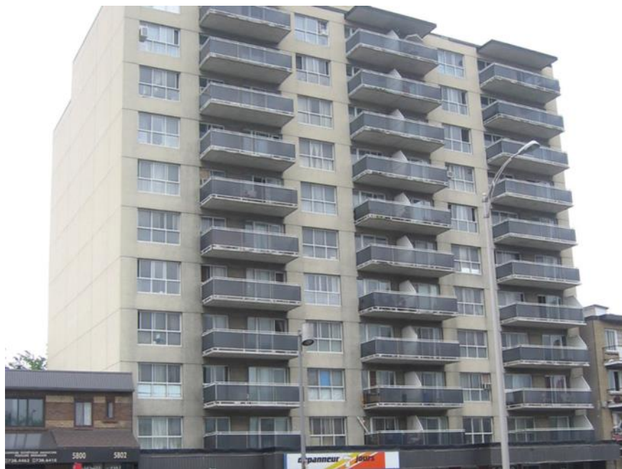
Habitation Bourret, boulevard Décarie