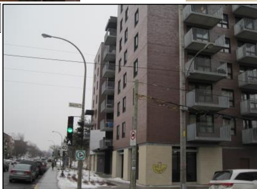
HLM Plamondon sur l'avenue Victoria à l'angle de l'avenue Barclay