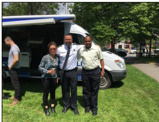
Commandant Sébastien de Montigny