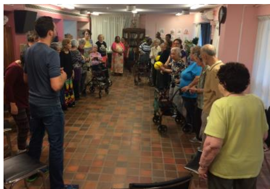
HLM Isabella et le kinésologue

Nous intervenons donc dans les HLMs Goyer, Isabella, Lavoie, Place Lucy, Place Newman et l'OSBL d'habitation Maison Côte-Ste-Catherine.