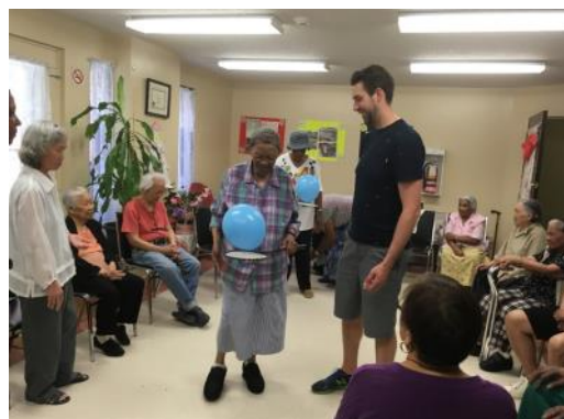
Place Newman et le kinésologue