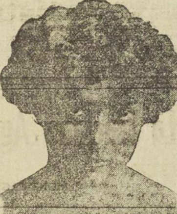
Pearl La Sage, actrice connue.

Votre teint rehausse votre apparence ou l'inverse.