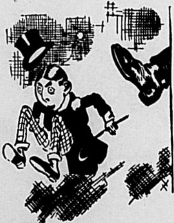
Un coup de pied dans le bas du tango.

L'élève. — Primitivement, la danse n'était qu'une manifestation de joie et se traduisait par des bonds et des sauts désordonnés. La civilisation aidant, tout se calma. Sous Louis XIV, habituées à ne se déplacer qu'en