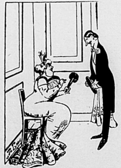
—Hélas! monsieur, la valse n'a qu'un temps!