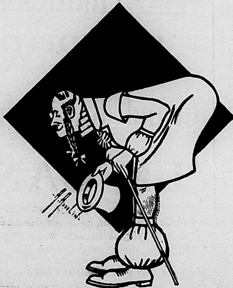
Tel qu'il sera le 18 Courant