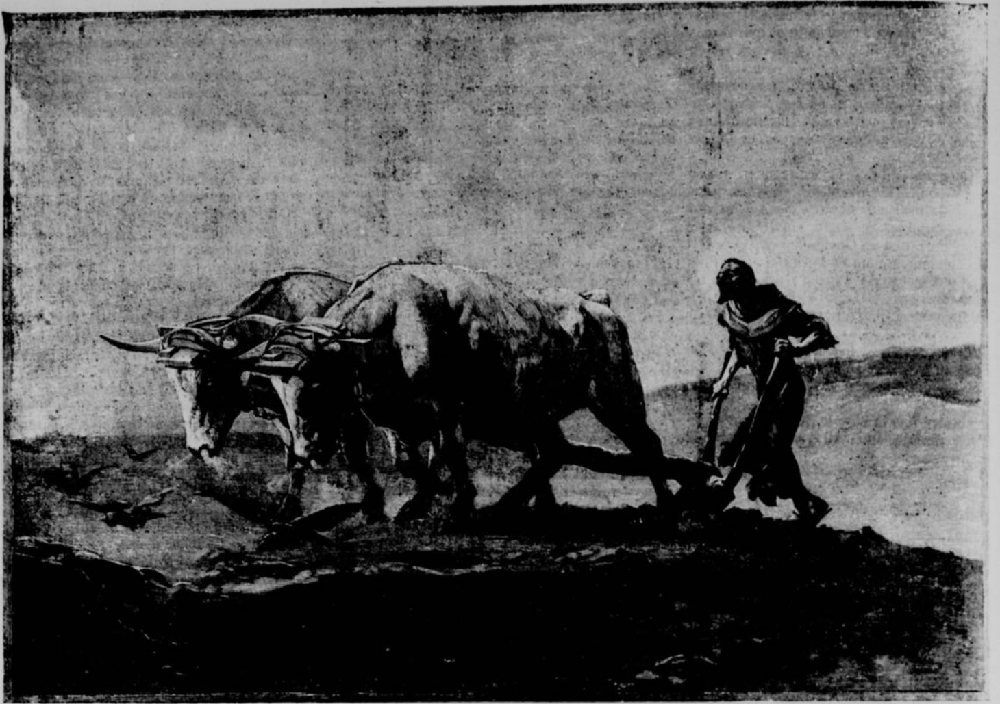
SALON DE 1894.—SAINT-FRANÇOIS D'ASSISES AU LABOUR, TABLEAU DE M. CHARTRAN