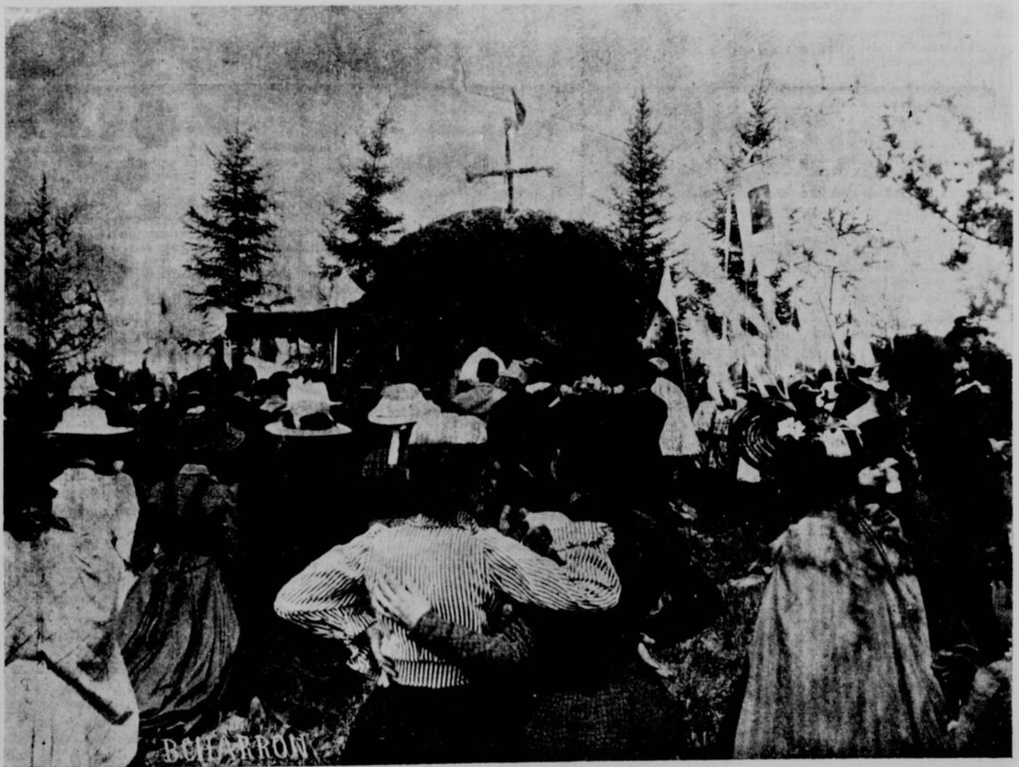
LAC TÉMISCAMINGUE.—LA FÊTE DIEU AUX PIEDS DES "QUINZE" : UN REPOSOIR