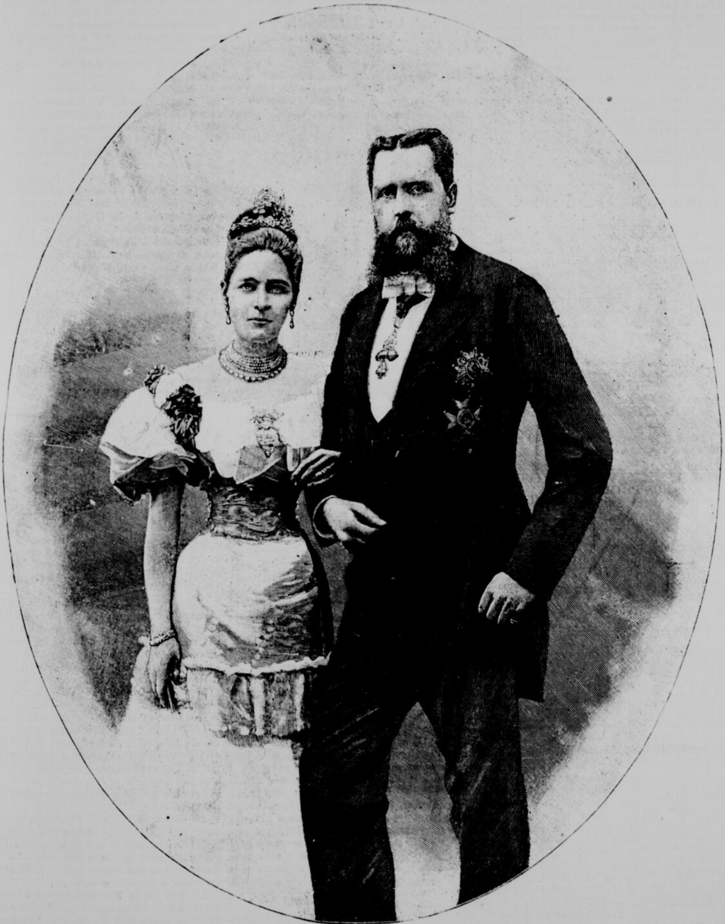
UN MARIAGE PRINCIER : DON CARLOS ET LA PRINCESSE DE ROHA

La ligne, par insertion - - - - 10 cents Insertions subséquentes - - - - 5 cents Tarif spécial pour annonces à long terme