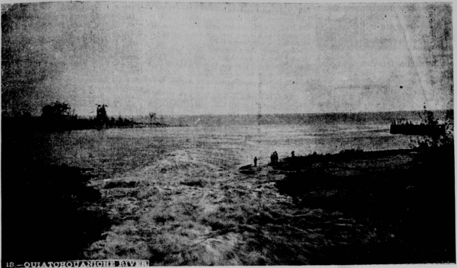
LAC SAINT-JEAN : LA RIVIÈRE QUIATCHOUANICHE