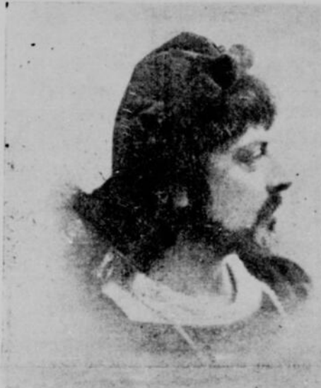
MOUNET-SULLY dans Hamlet

Irving s'est montré à nous sous les traits d' Hamlet , chef-d'œuvre de l'immortel Shakespeare, et de Thomas Becket , drame assez médiocre du grand poète Tennyson, sauvé du naufrage par le grand tragédien. Nous avons pu voir Mounet-Sully dans Andromaque , de Racine, Hernani et Ruy Blas , de Victor Hugo, Edipe-roi de Sophocle, et ce même Hamlet , dans lequel le tragédien anglais a remporté tant de triomphe.