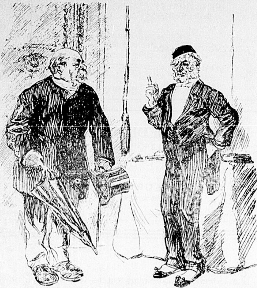
L'HUISSIER. — Chut! il est défendu de le réveiller dans l'après-midi.

(3 heures de l'après-midi) Aux appartements officiels du gouverneur