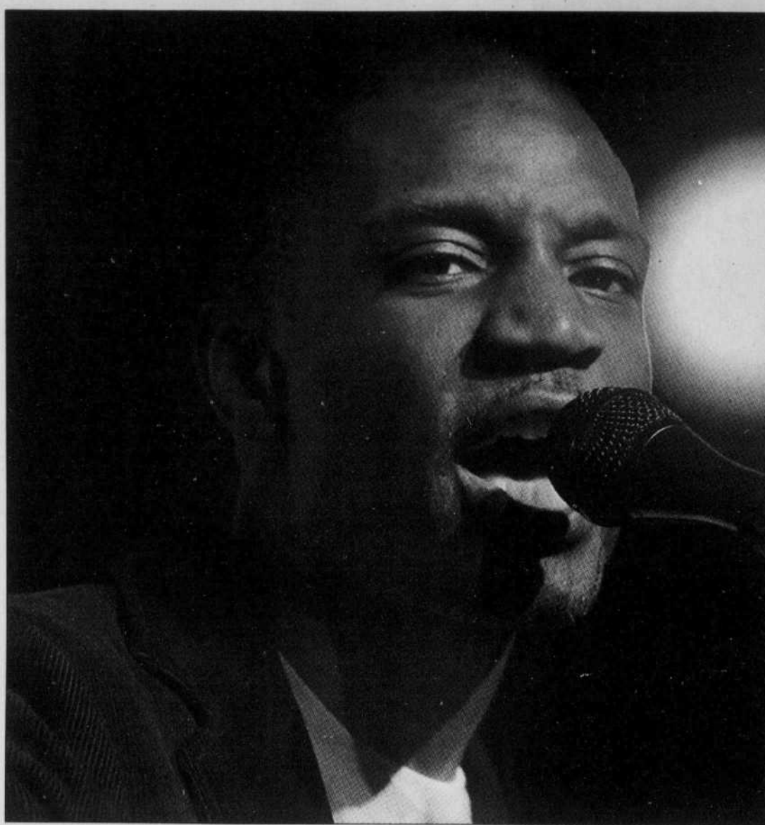
Le rappeur français Abd al Malik en concert au Festival de Fès de la culture soufie, au Maroc en mai dernier.

La discussion avec Abd al Malik est ponctuée de multiples réflexions, de phrases sages, de constats philosophiques et spirituels. Quand on lui demande s'il a peur qu'on lui appose une étiquette religieuse, le rappeur a sa réponse toute prête. «Moi, je n'ai peur de rien. Montaigne a dit: "Tout entier, et tout nu". Ça veut dire qu'à partir du moment où on a une démarche person-