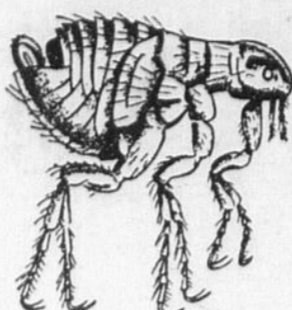
No 7 - La Puce Redoutez ses piqûres

Pour leur malheur, les chiens et les chats exercent une puissante attraction sur ces infimes parasites qu'on appelle les puces. Il arrive souvent aussi que les puces quittent la toison du chien ou du chat pour se réfugier dans les tapis, les meubles, les tentes, les planchers et les caves. Seule la puce adulte pique ses victimes. Ses piqûres sont douloureuses et parfois graves de conséquences.