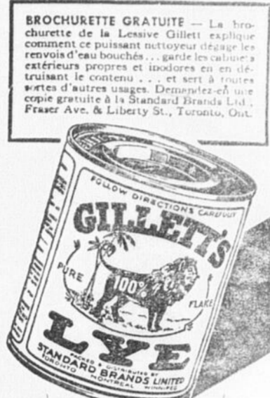
*Ne faites jamais dissoudre la lessive dans l'eau chaude. L'action de la lessive elle-même réchauffe l'eau.

UNE solution* de Lessive Gillett Pure en Flocons peut simplifier vos travaux de ménages de multiples façons. Elle dégage les renvois d'eau obstrués, nettoie aisément les ustensiles et évite le frottage parce qu'elle s'attaque directement à la saleté et la fait vite disparaître. Gardez-en toujours à la maison.