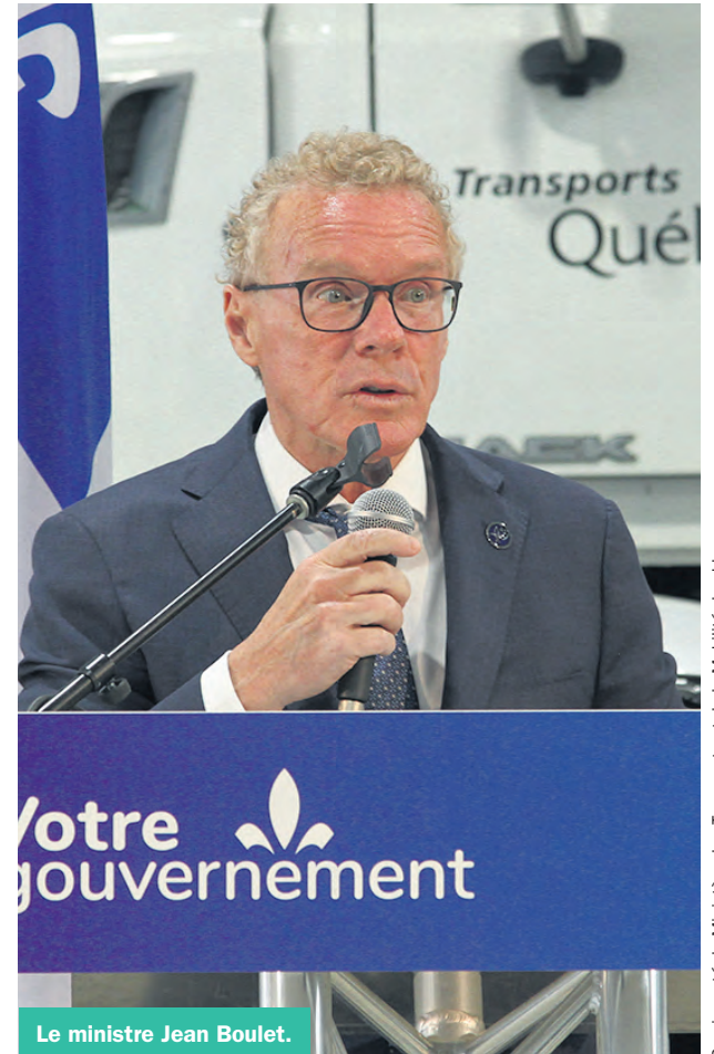
Le ministre Jean Boulet.

L'annonce a été faite par le ministre du Travail et ministre responsable de l'Abitibi-Témiscamingue, Jean Boulet, au nom de la ministre des Transports et de la Mobilité durable, Geneviève Guilbault.