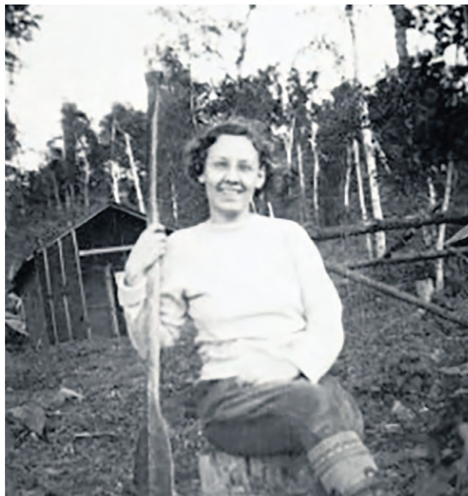
À défaut d'avoir réussi à mettre la main sur une photo de Madame Gamble, voici une resplendissante pionnière qui semble filer le parfait bonheur dans le canton de Rouyn.

n'est pas clair dans son entrevue (1) cependant si le terrain de tennis était sur l'île (ce qui semble peu probable!) ou si elle jouait sur l'actuel terrain de tennis construit par la compagnie Noranda qui se trouvait, en quelque sorte, derrière chez elle. C'est toutefois le golf qui était son activité préférée. Elle a même gagné le championnat du club de golf de Noranda, peu après son ouverture, alors qu'elle n'était qu'une débutante!