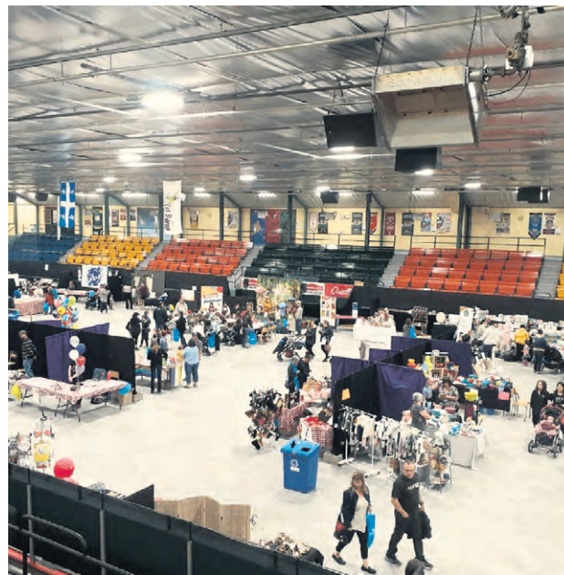
Un rendez-vous familial sous le signe de la découverte et de l'amusement.

Le programme comprend également une clinique de vérification de sièges d'auto, ainsi qu'une série de spectacles et