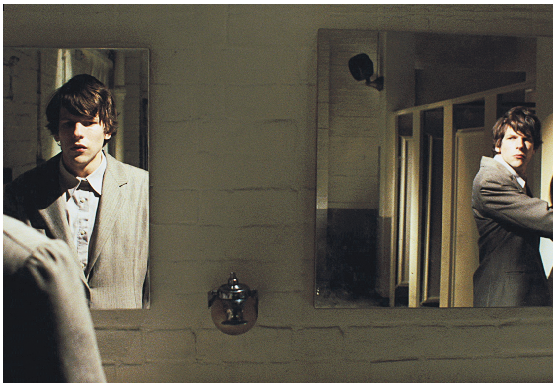
The Double est réalisé avec un soin extrême, des cadrages maniaques, des éclairages parfaits.

Ici, Jesse Eisenberg incarne Simon, un jeune fonctionnaire timide et zélé que personne ne remarque, même pas sa flamme, Hannah, la jeune voisine d'immeuble et de bureau (Mia Wasikowska, actrice dont le minois enfantin apparemment sorti d'une bande dessinée fait fureur). Mais voilà que James, un être en tous points identique à lui (joué également par Eisenberg), mais pé-