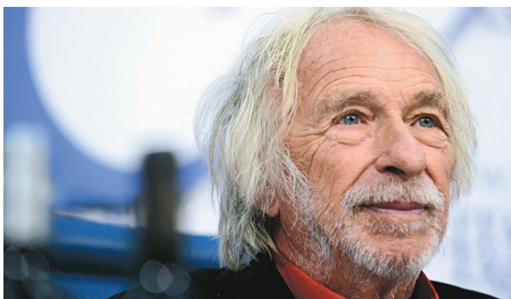
VASILY MAXIMOV AGENCE FRANCE-PRESSE

Texte: Rébecca Déraspe. Mise en scène: Sébastien Gauthier. Du 20 juin au 23 août, à Blainville.