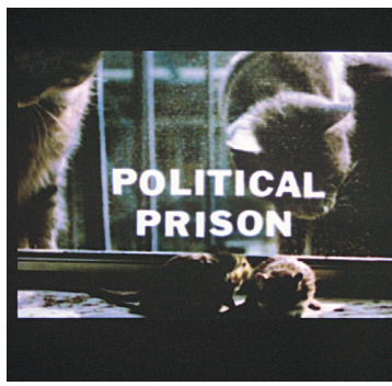
Des images de Rat Life and Diet in North America de Joyce Wieland.

qui, dans les circonstances, pourra évoquer celui d'une mitrailleuse... Cela débute dans l'espace d'une maison, dans l'espace privé, pour se poursuivre dans l'espace public, dans les rues et sur les bords du lac Ontario.