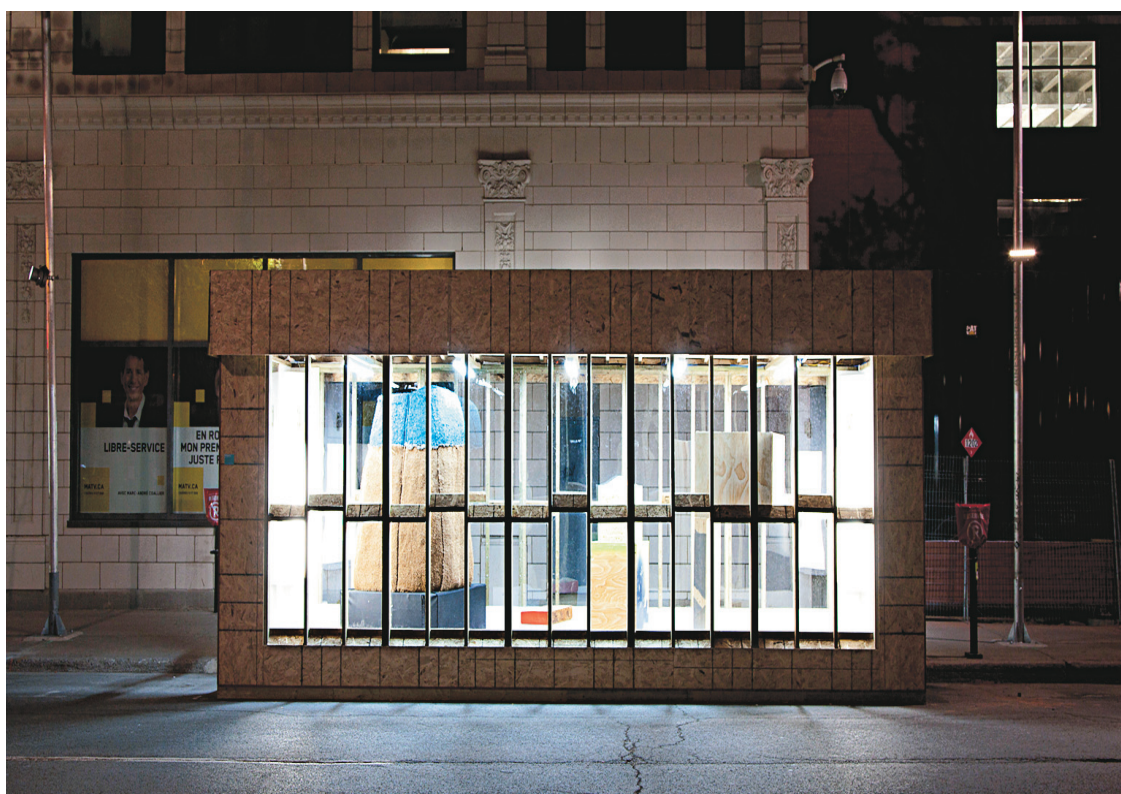
Nicolas Fleming, Il s'occupait, c'est vrai, de nos intérêts et de nos biens , 2014, matériaux mixtes.

En cela, un tel événement d'art contemporain soulève des questions sur ses modalités d'inscription dans l'espace public, lequel ici est chargé à la fois de signes et de spectateurs potentiels. Les œuvres doivent-elles mimer les composantes contextuelles et jouer d'une discrétion critique, heurter par leur présence les piétons et les usagers ou