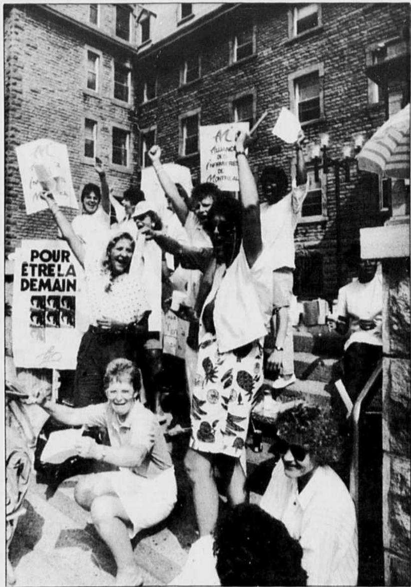
Malgré les pertes d'ancienneté, les infirmières des lignes de piquetage semblent gonflées à bloc.

La moitié du personnel de l'avion, un Convair/Metropolitan CV-58, s'est abîmé dans les eaux du Skagerrak à une trentaine de kilomètres au nord de la ville de Hirtshals, l'extrémité septentrionale du Danemark, alors qu'il assurait la liaison Oslo-Hambourg.