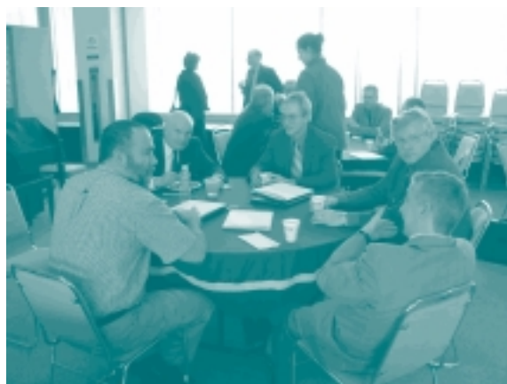
Les gens échantent lors du repas du midi.