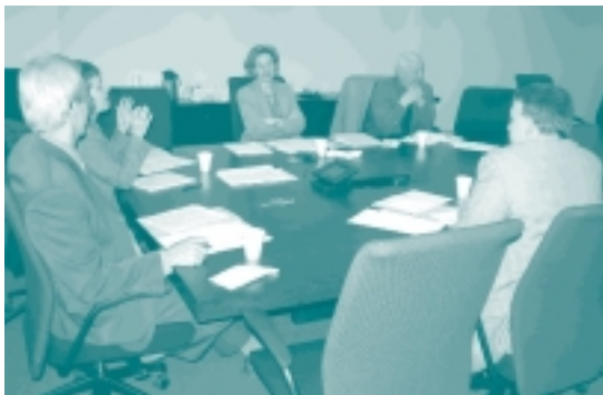
Une rencontre à Montréal...

Le but de ces échanges d'idées entre les responsables de la vérification interne présents était de mettre en lumière les principales problématiques qui toucheront la fonction vérification interne, les enjeux pour les trois prochaines années et les orientations à retenir dans cette optique.