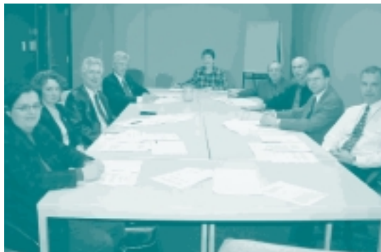
... et une rencontre à Québec.