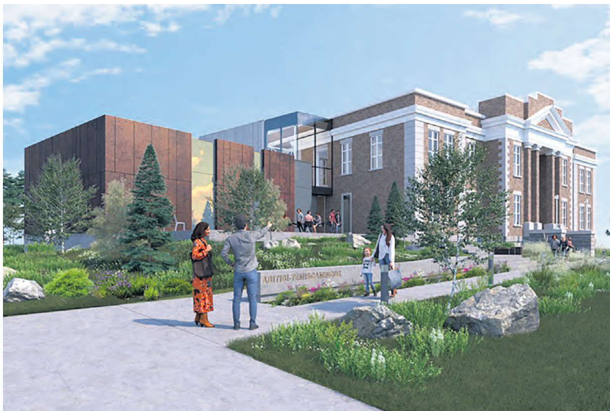
Le Vieux-Palais d'Amos, le premier palais de justice implanté en Abitibi-Témiscamingue en 1922, sera transformé en lieu culturel au coût de 26,1 M$