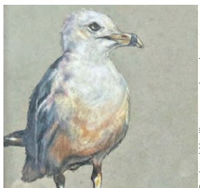
Caviato (détail), crayons de couleur et encre 2022 © Louise Letendré