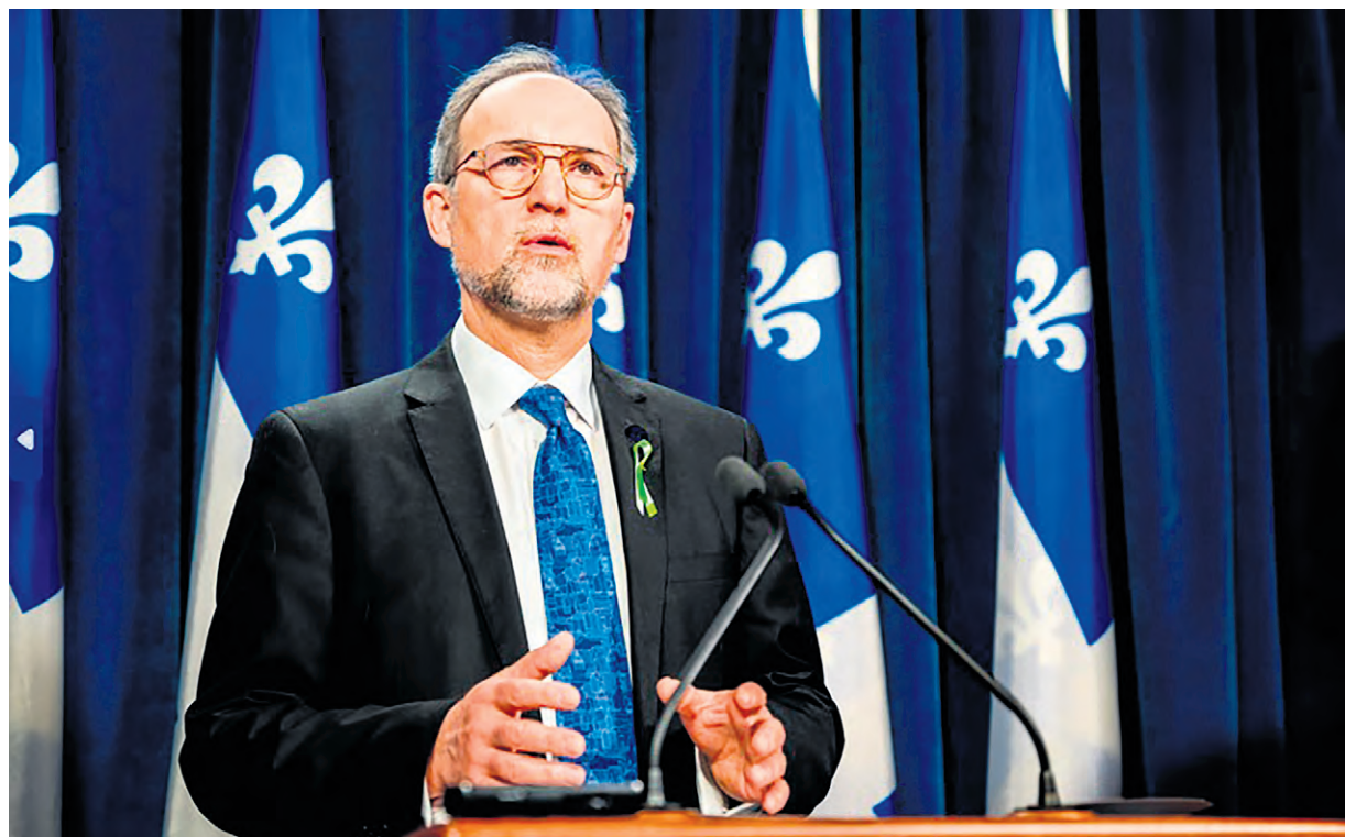
L'opposition libérale a profité de la période de questions pour dénoncer les propos tenus par le député d'Abitibi-Est, Pierre Dufour, lors de la séance du Conseil municipal du 15 mai dernier.

Le ministre Lionel Carmant a rappelé le travail qui se fait actuellement sur le terrain, avec les refuges, l'hébergement de transition et les logements supervisés. Il a aussi rappelé que le tout était supervisé par une intervenante