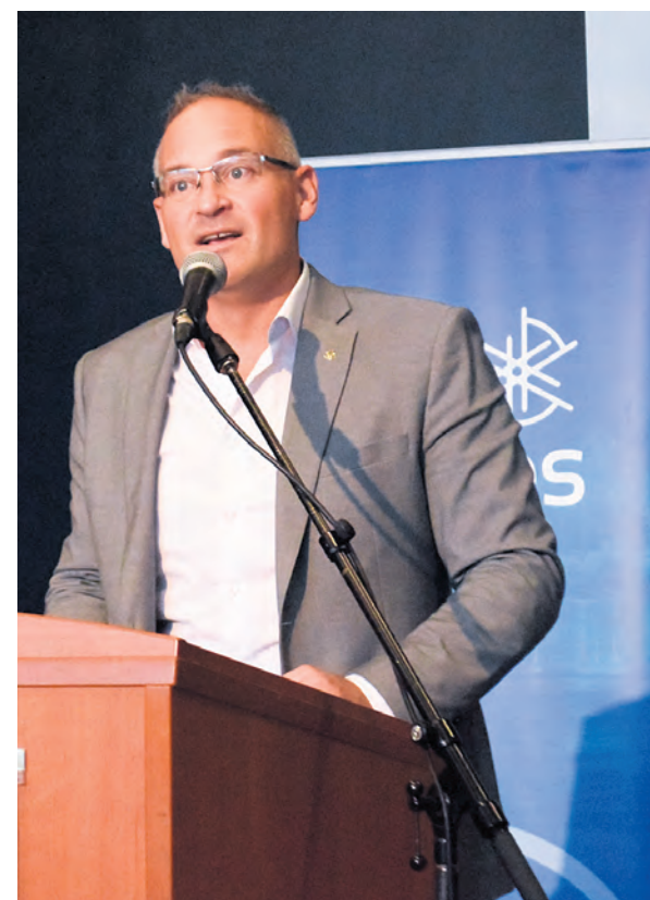
Le volet touristique de la MRC d'Abitibi aura 123 000 $ en investissements.

Finalement, la Ferme Chalpagas (3007 $) agrandira son atelier de transformation de la fibre naturelle.