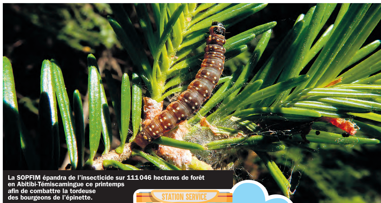
La SOPFIM épandra de l'insecticide sur 111 046 hectares de forêt en Abitibi-Témiscamingue ce printemps afin de combattre la tordeuse des bourgeons de l'épinette.

La campagne de pulvérisation aérienne se déroulera de la fin mai à la fin juin. La SOPFIM soutient qu'elle utilisera un insecticide biologique appelé « BTK » (Bacillus Thuringiensis, variété Kurstaki), qui s'est démontré sécuritaire pour les humains, les animaux, la végétation et l'environnement, en plus d'être homologué par Santé Canada. La SOPFIM maintient que son programme de pulvérisation aérienne vise à « réduire les populations de tordeuse des bourgeons de l'épinette (TBE), de manière à protéger au moins 50% du feuillage annuel. » La TBE est l'insecte ravageur le plus destructeur des forêts de conifères du Québec, particulièrement dû au fait qu'il s'attaque aux nouvelles pousses des sapins et des épinettes. Afin de réaliser son mandat dans la région, la SOPFIM établira 3 bases d'opérations, qui seront situées à Val-d'Or, Amos et Lebel-sur-Quévillon.