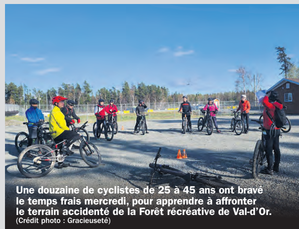
Une douzaine de cyclistes de 25 à 45 ans ont bravé le temps frais mercredi, pour apprendre à affronter le terrain accidenté de la Forêt récréative de Val-d'Or.