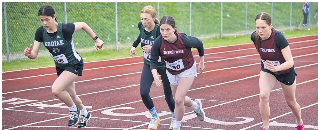
Au total, près de 200 élèves provenant des centres de services scolaires Abitibi, Harricana et de l'Or-et-des-Bois ont compétitionné au sein des catégories benjamines, cadettes et juvéniles.

Sans partage et au-dessus du lot, le CSSOB et le CSSH se sont offert l'ensemble des bannières distribuées dans chacun des compartiments de ce championnat régional scolaire d'athlétisme.