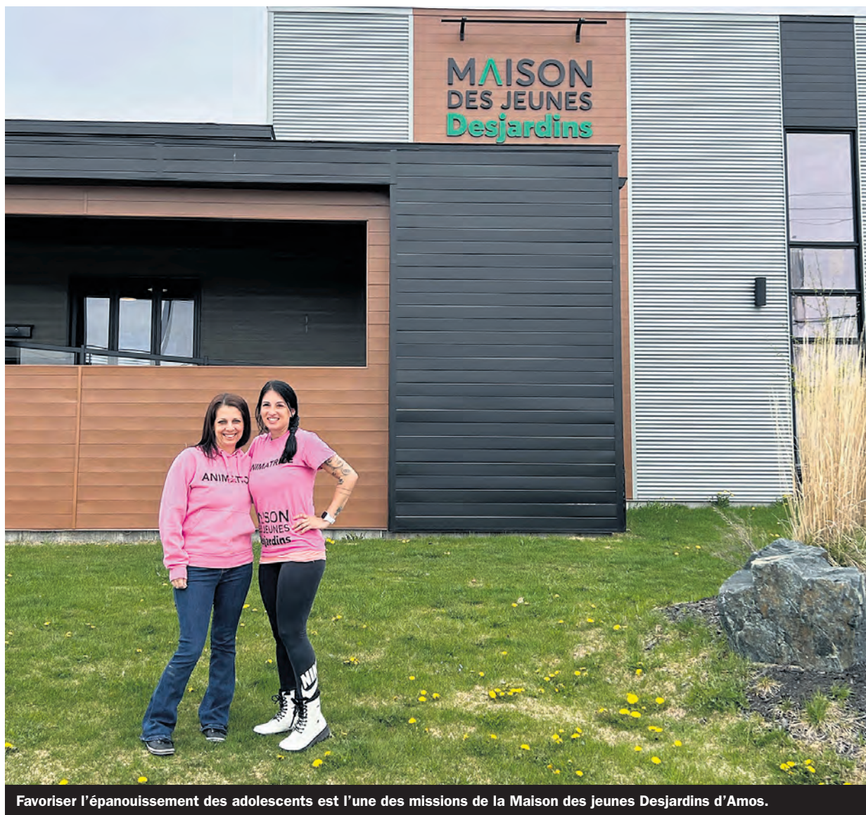
Favoriser l'épanouissement des adolescents est l'une des missions de la Maison des jeunes Desjardins d'Amos.