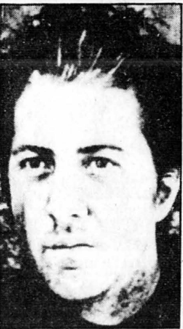
Dustin Hoffman.