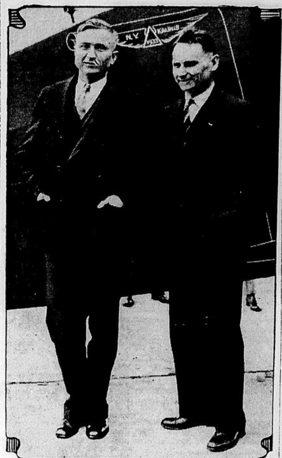
Le capitaine Stephen Darius (à gauche) et Stanley Girenas photographés à leur arrivée à l'aérodrome Floyd Bennett, New-York, le 8 mai, avec leur aéroplane, le "Lithuanica", dans lequel ils se proposent de tenter la traversée de l'Atlantique de New-York à Kaunas, Lituanie. Ils montrent leur appareil au point en attendant leur prochain départ.