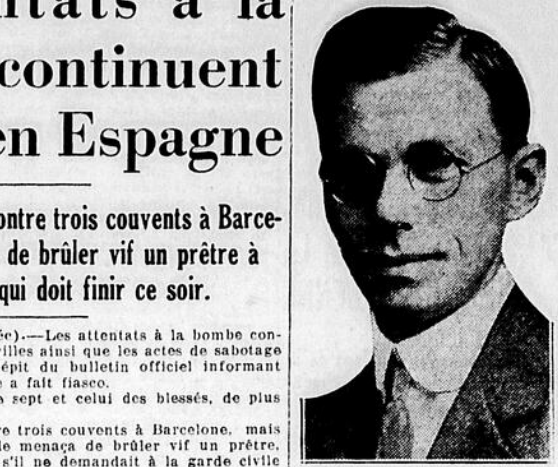
M. James Bryant Conant, professeur de chimie organique à l'université de Harvard, élu président de cette institution à Cambridge, Massachusetts, le 8 mai.