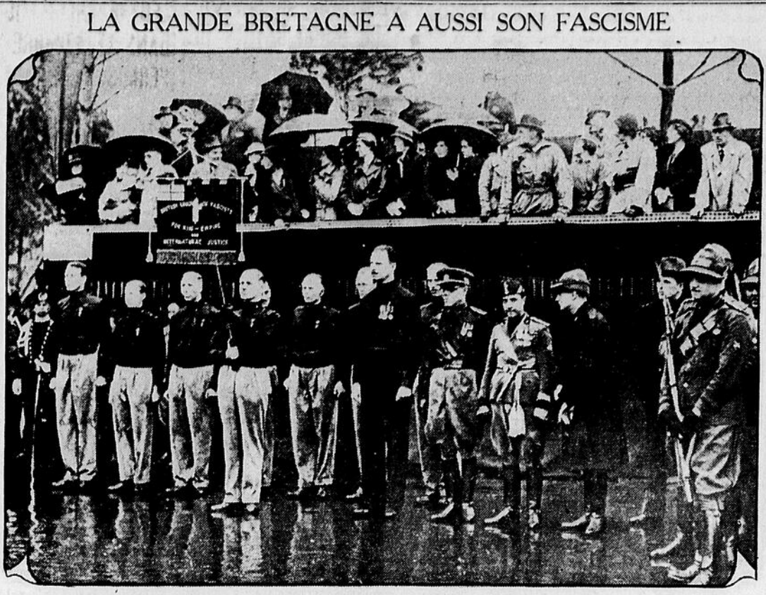
SIR OSWALD MOSLEY (au centre), chef du parti fasciste, un nouveau-né dans le monde politique anglais, passe en revue quelques milliers de chemises noires à Rome.

PARIS, 11 mai. — Les viticulteurs français ont eu des recherches américaines de chercher par l'appât de l'or ou par intimidation à acquérir des droits exclusifs sur la vente en Amérique des principaux vins français.