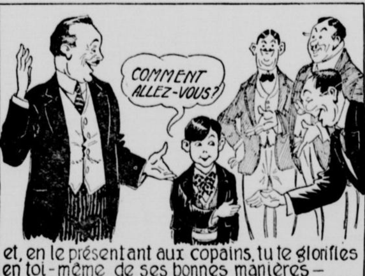
et, en le présentant aux copains, tu te glorifies en toi-même de ses bonnes manières —