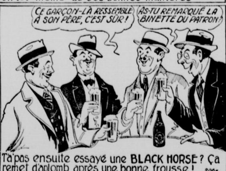
T'a pas ensuite essayé une BLACK HORSE ? Ça remet d'aplomb après une bonne frousse! 200r