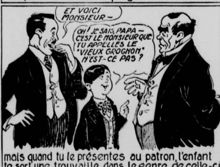
mais quand tu le présentes au patron, l'enfant te sort une trouvaille dans le genre de celle-ci