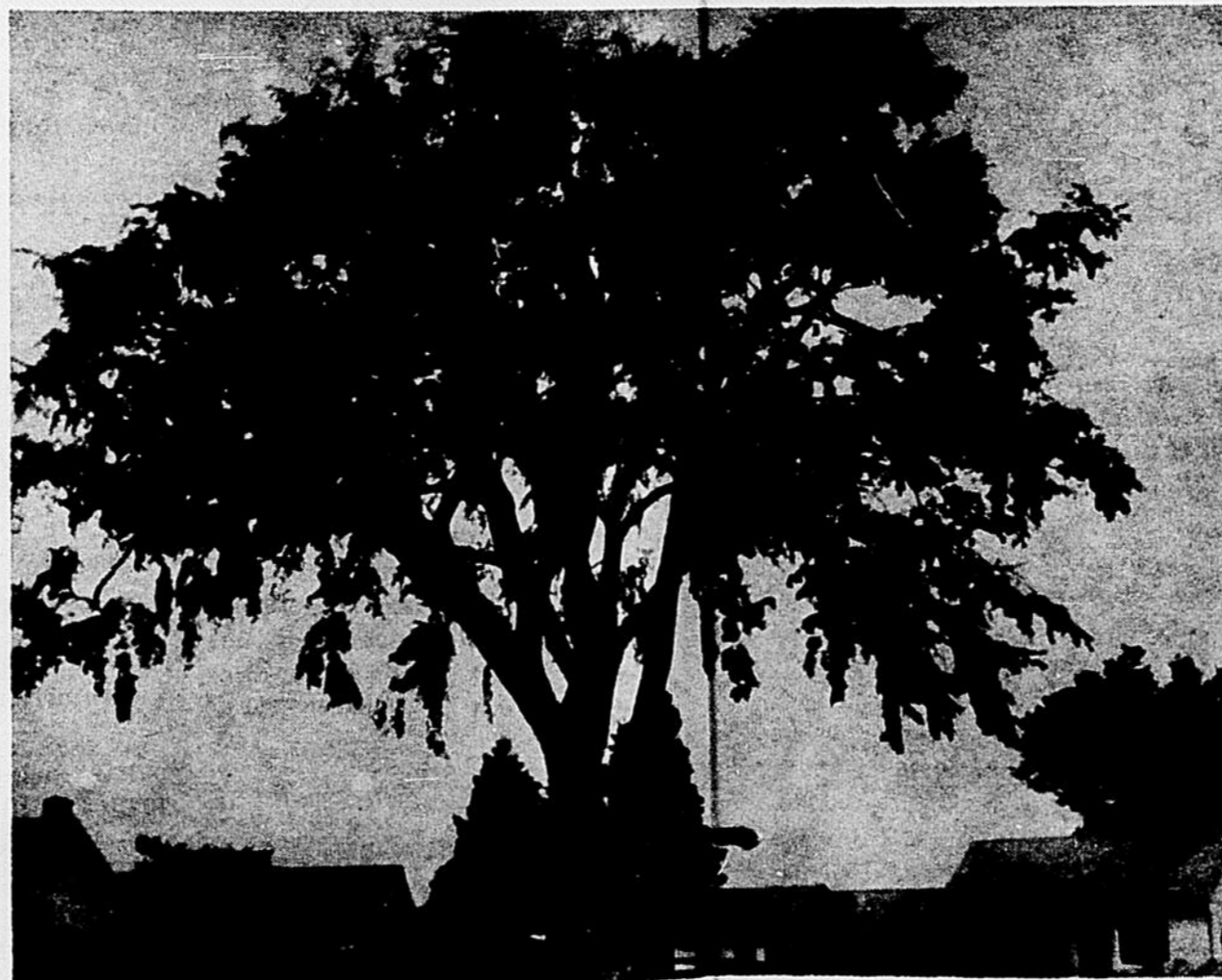
L'orme des Hamel — Tiré d'une nouvelle publiée dans les Récits Laurentiens.

En 1963, plus de 83,300.00 ont été distribués en bourses d'étude universitaire, en argent et en matériel scientifique à la seule exposition de Montréal.