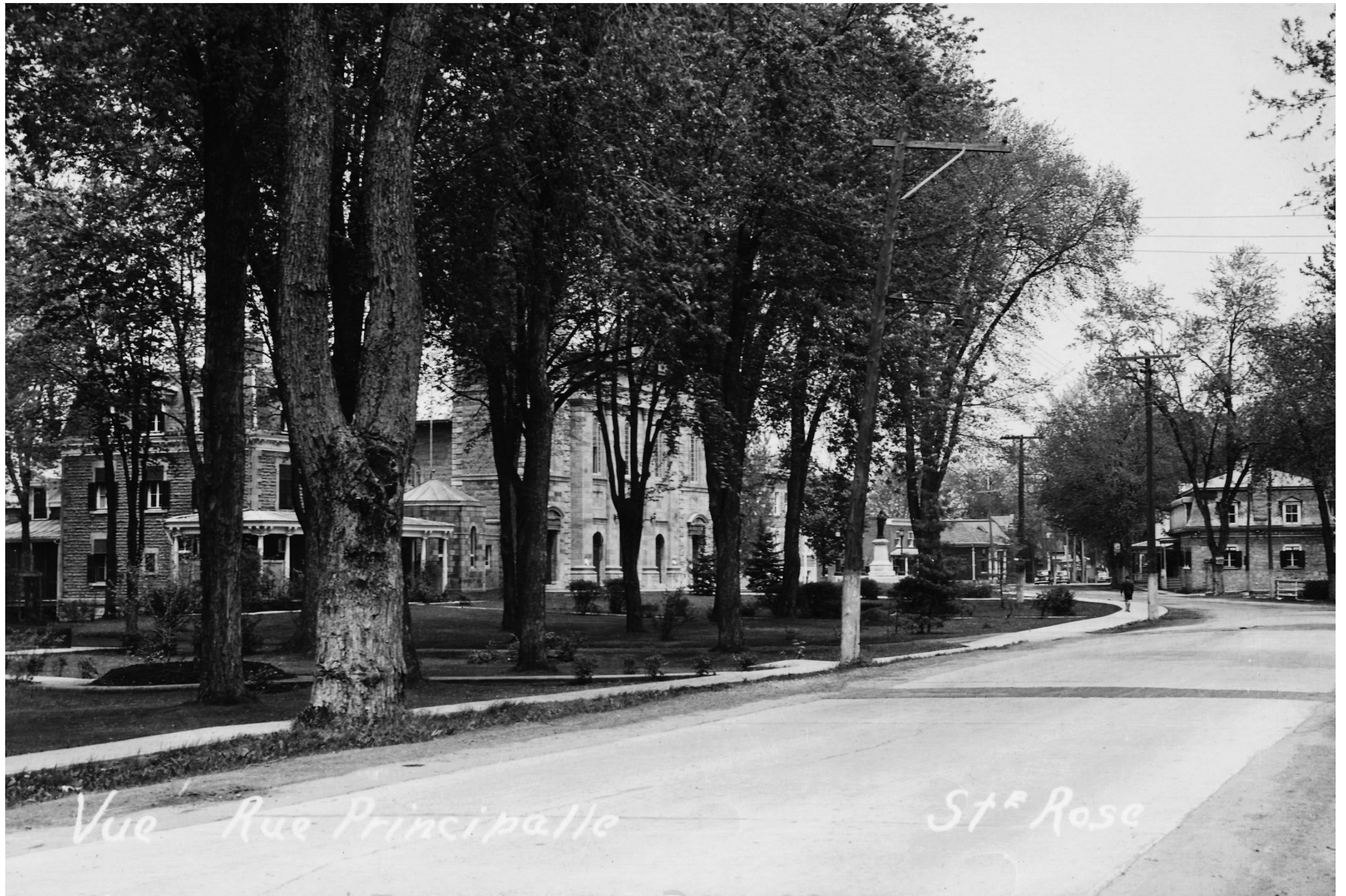
Vue Rue Principalle