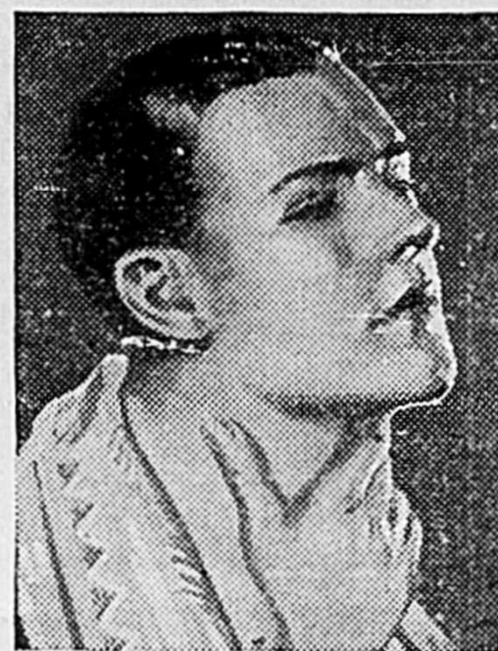
Pour le rendre encore plus stimulant, avant d'appliquer Vicks, frottez le peau de la gorge et de la poitrine avec des serviettes d'eau chaude.

VOICI comment soulager la toux et le mal de gorge: Toutes les deux ou trois heures, mettez-vous un peu de Vicks sur la langue et laissez-le descendre tranquillement dans la gorge, au fur et à mesure qu'il fond.