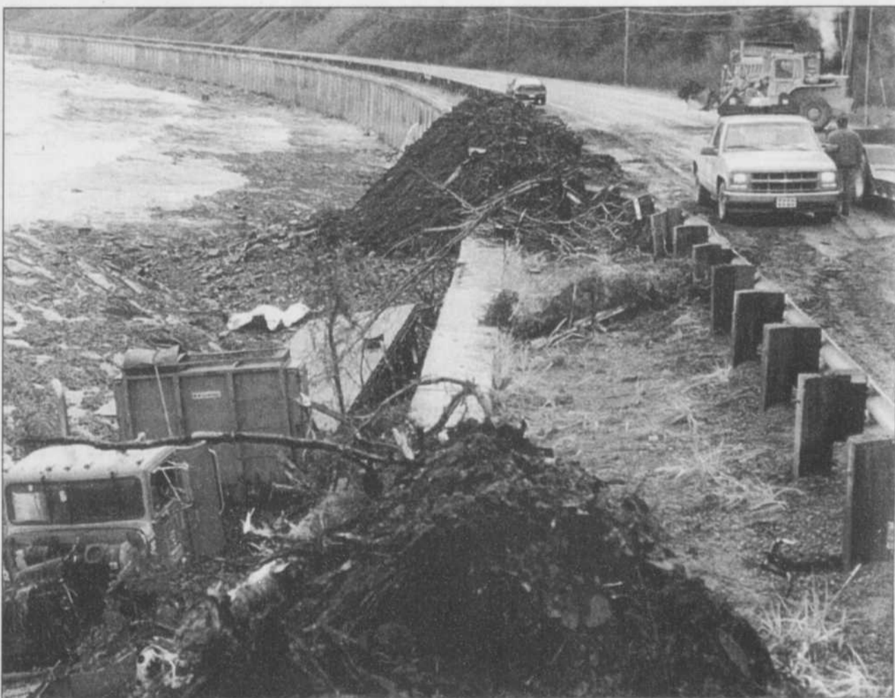
Le conducteur de ce camion-remorque a eu une chance inouïe lorsque son camion a été emporté par un glissement de terrain. Il s'en est tiré avec des blessures mineures et un choc nerveux.

La pluie abondante a débuté jeudi soir en Gaspésie. Depuis, près de 300 résidences ont été affectées, entre La Martre et Gaspé. Plus d'une cinquantaine de familles ont été évacuées. Gaspé, Cloridorme et Grande-Vallée ont acheminé des demandes d'aide financière pour éponger les coûts des inondations.