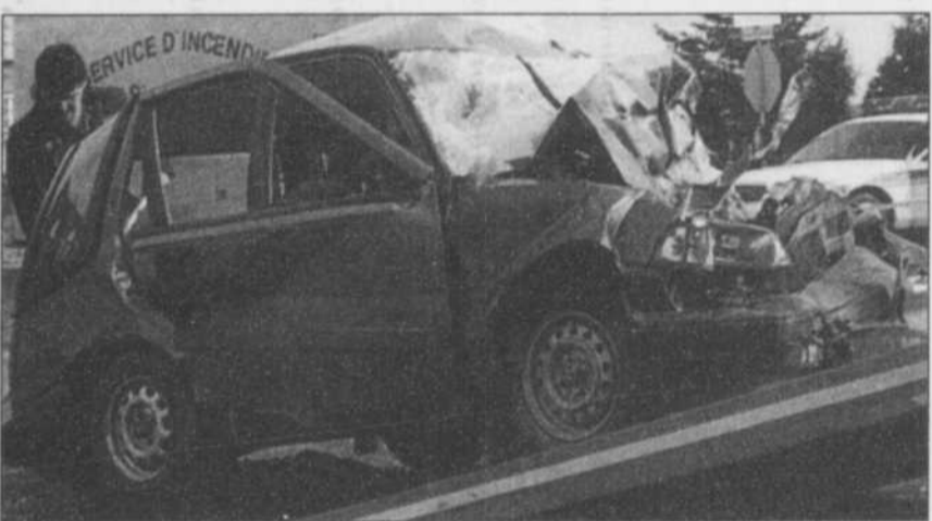
L'état de la Honda Civic montre la violence de l'impact.

La chambre hyperbare de Rimouski sert aussi à un certain nombre de cas dits urgents dont la gangrène gazeuse, ce qui a évité l'an passé à un citoyen de Mont-Joli l'amputation d'une jambe.