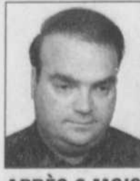
APRÈS 6 MOIS