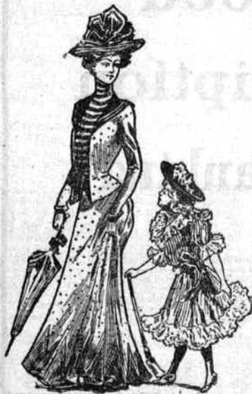
TRES CHIC ET DE SAISON