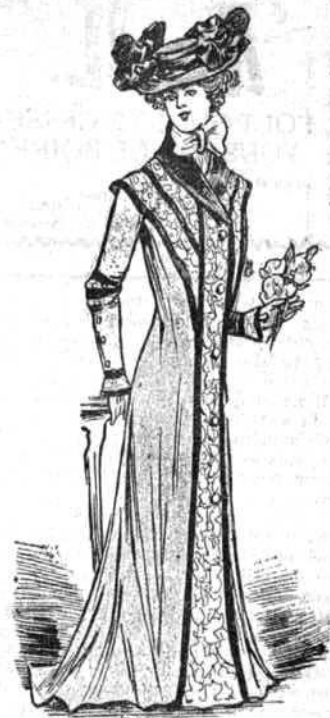
Longue redingote de drap cerise garnie d'une étoile de guipure encadrée de veours noir formant collet dans le haut. Chapeau de feutre orné de choux et de velours.