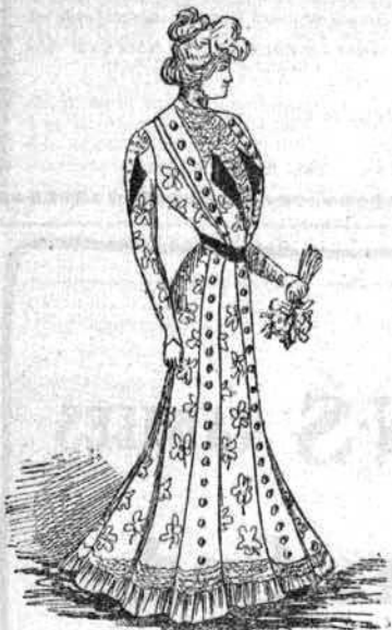
RAVISSANTE TOILETTE D'INTERIEUR