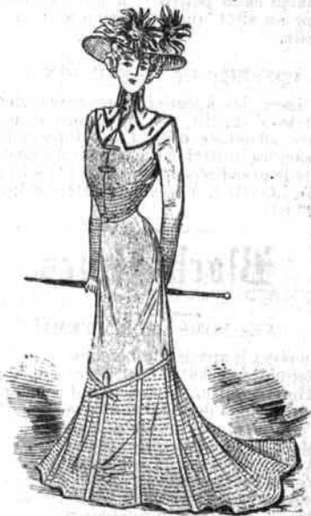
Costume de drap garni de piqûres et de biais piqués, le boléro croisé de pattes semblables et orné d'un double collet d'hermine rehaussé d'un col haut et rabattu. Capeline de feutre garnie de soleils de velours.