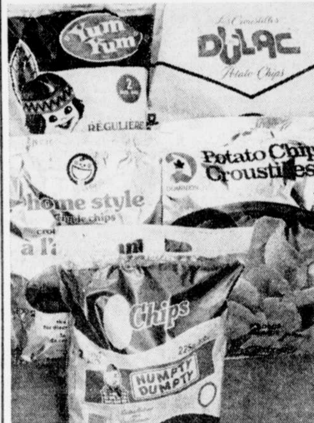
Les études révèlent que les croustilles sont grasses, trop salées, et très peu nutritives. Plusieurs marques en offrent même de très rances.