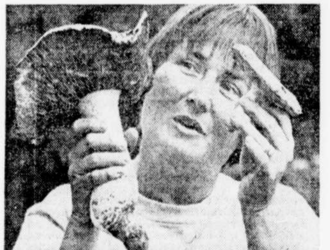
A Vancouver, on nomme "money mushrooms" ces Armillaria Ponderosa. Ceux qui les cueillent sont payés $10 le kilo de champignons, qui sont exportés au Japon.