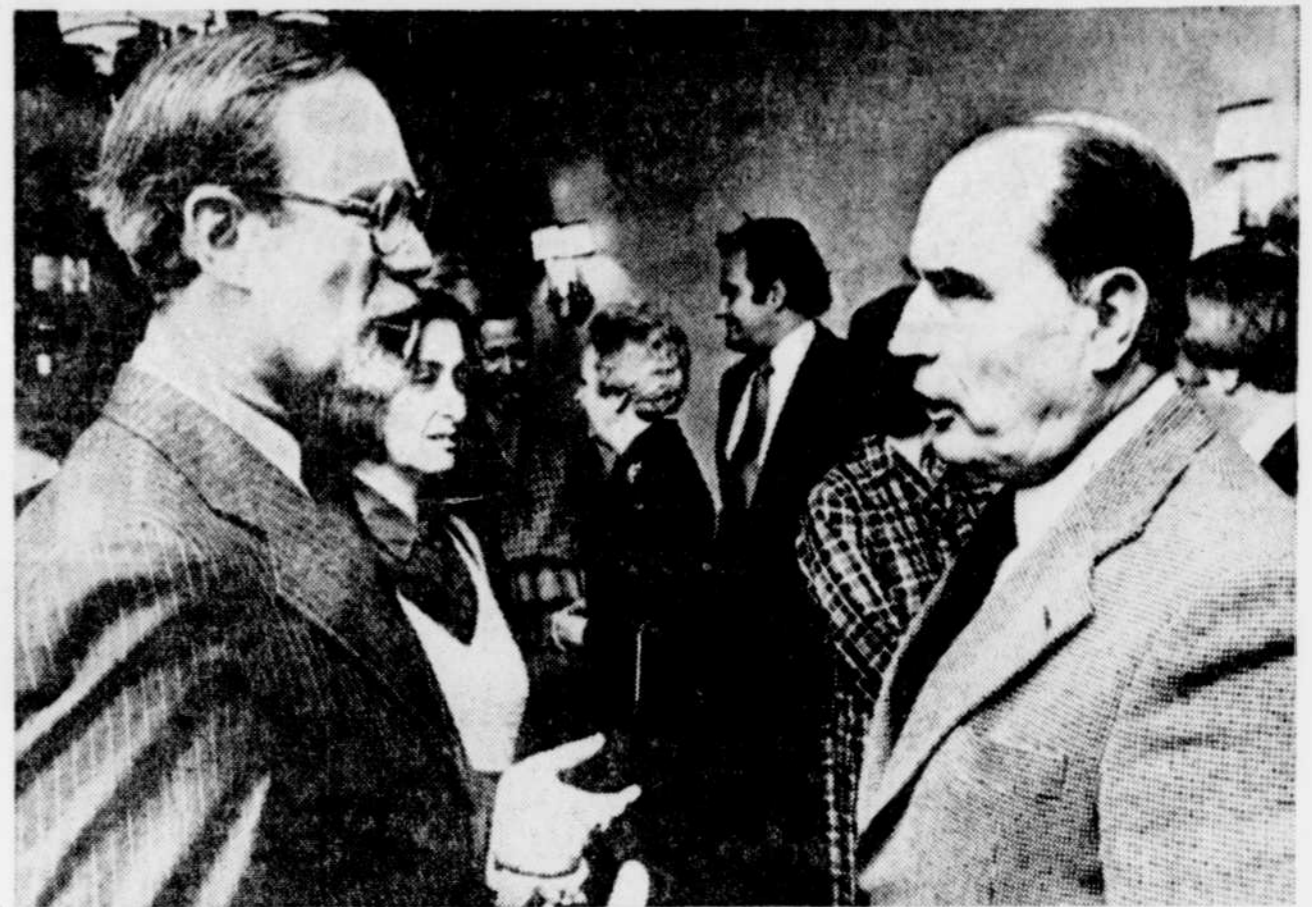
Morin reçoit Mitterrand

Le gouvernement exige de 10 à 14 semaines de travail, dans les régions où le taux de chômage varie de 6 à 9 pour 100. Il paie une semaine de prestations pour chaque semaine travaillée, jusqu'à un maximum de 25 semaines. Il paie une autre semaine de prestations pour chaque deux semaines travaillées, jusqu'à 13 autres semaines.