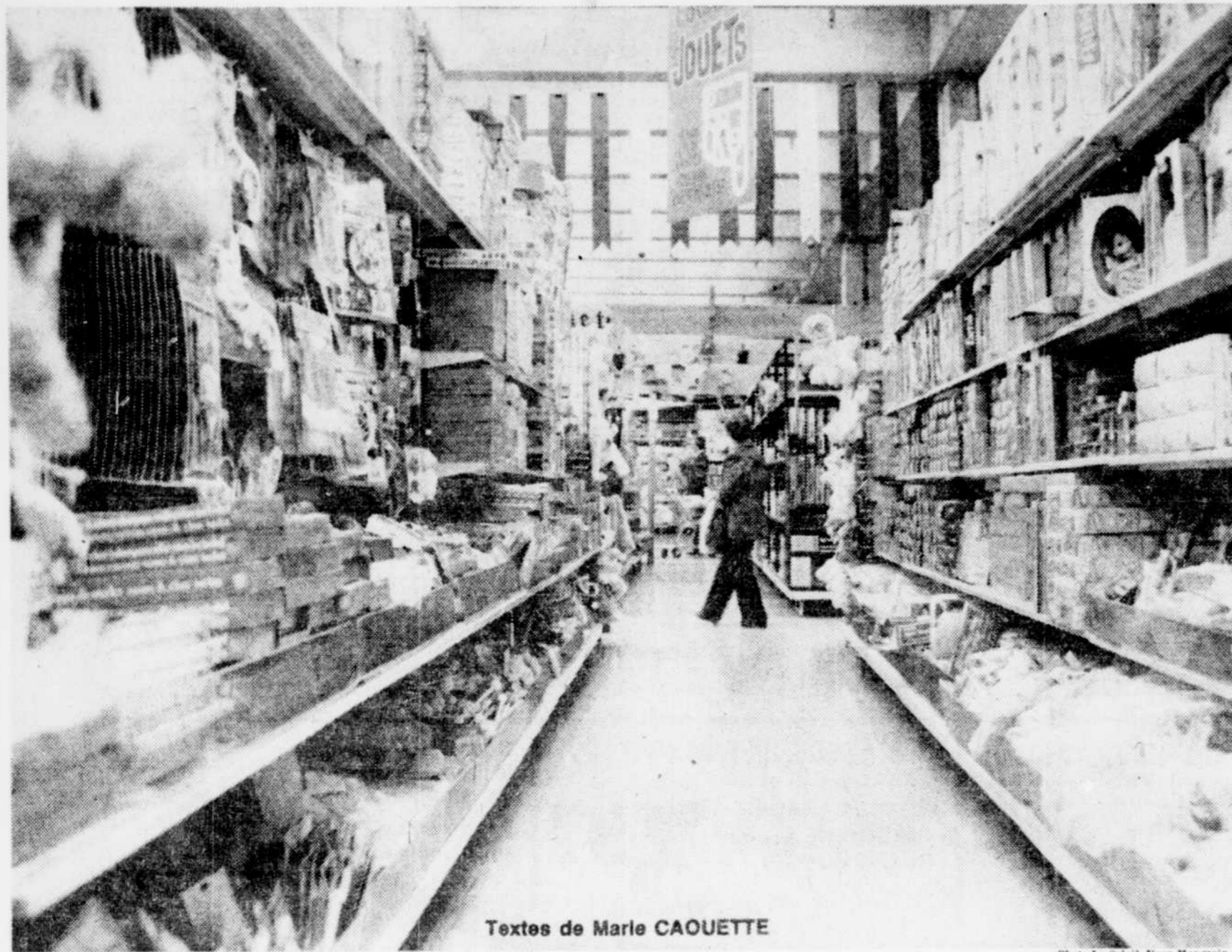
Textes de Marie CAQUETTE