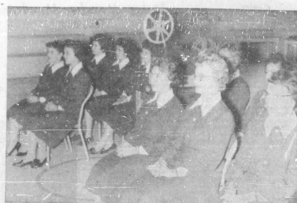
CINE-CLUB A VILLE-MARIE — Les demoiselles de l'École normale de cette ville ont organisé un ciné-club, afin de profiter des avantages que procure le cinéma comme moyen de culture. L'attention doit être portée sur ces jeunes filles témoins de leur intérêt pour le film au programme.