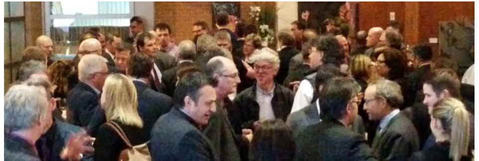
Moment de réseautage

Le 19 janvier avait lieu le Cocktail – Lancement de la programmation que nous qualifions de vif succès. Plus de 150 personnes s’y étaient inscrites. Monsieur Martin Coiteux, alors Ministre responsable de l’Administration gouvernementale et de la Révision permanente