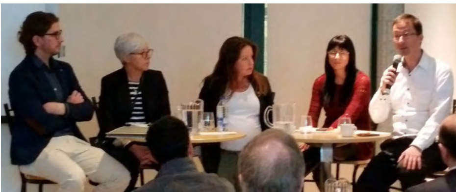
Les cinq conférenciers réunis pour la période des questions.

Les experts ont partagé leurs expériences liées à l’avant, pendant et après implantation de leur réseau social d’entreprise.