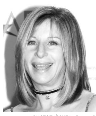
PHOTOTHÈQUE La Presse © Barbra Streisand

22:30 r - LE GRAND BLOND Invitée: France D'Amour qui parle et chante. Au Club, discussion sur les films tristes. Une reprise.