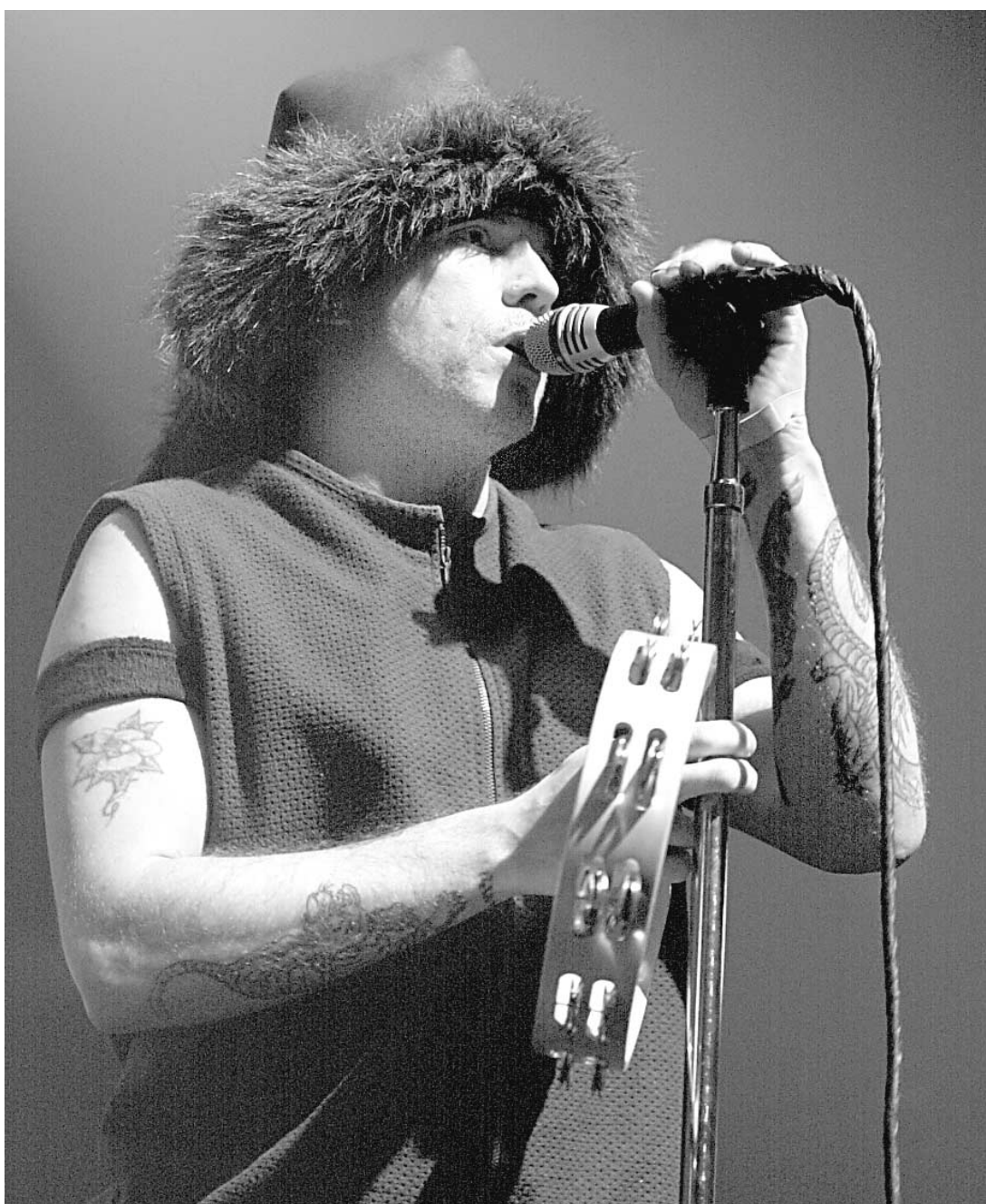
Ian Astbury, chanteur du groupe The Cult.