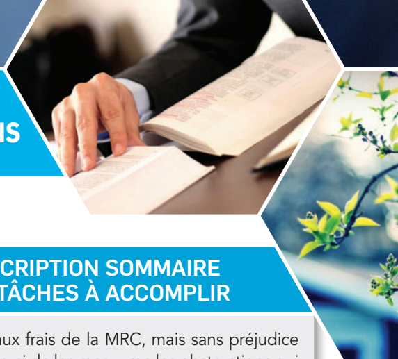
Tableau 1 - Suite