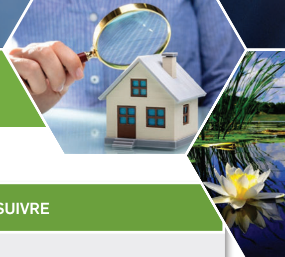
Tableau 3 - Suite