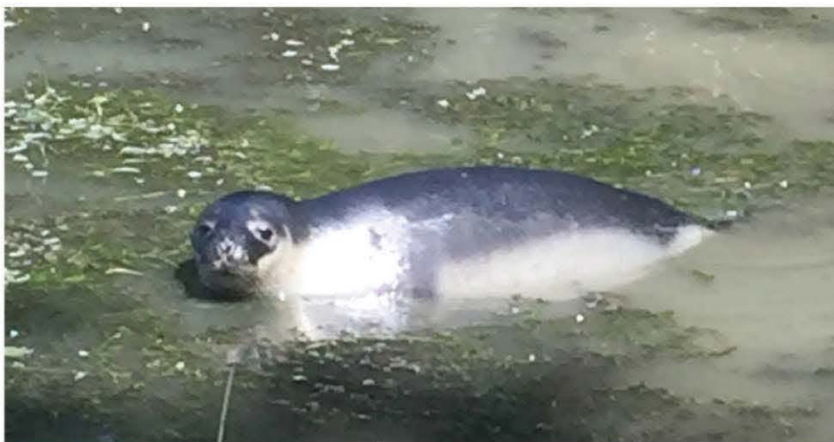
L'animal aperçu dans le Richelieu a été vu pour la dernière fois le 15 août dernier. Il s'agit également d'un phoque à capuchon, une espèce dont la population est en croissance actuellement.