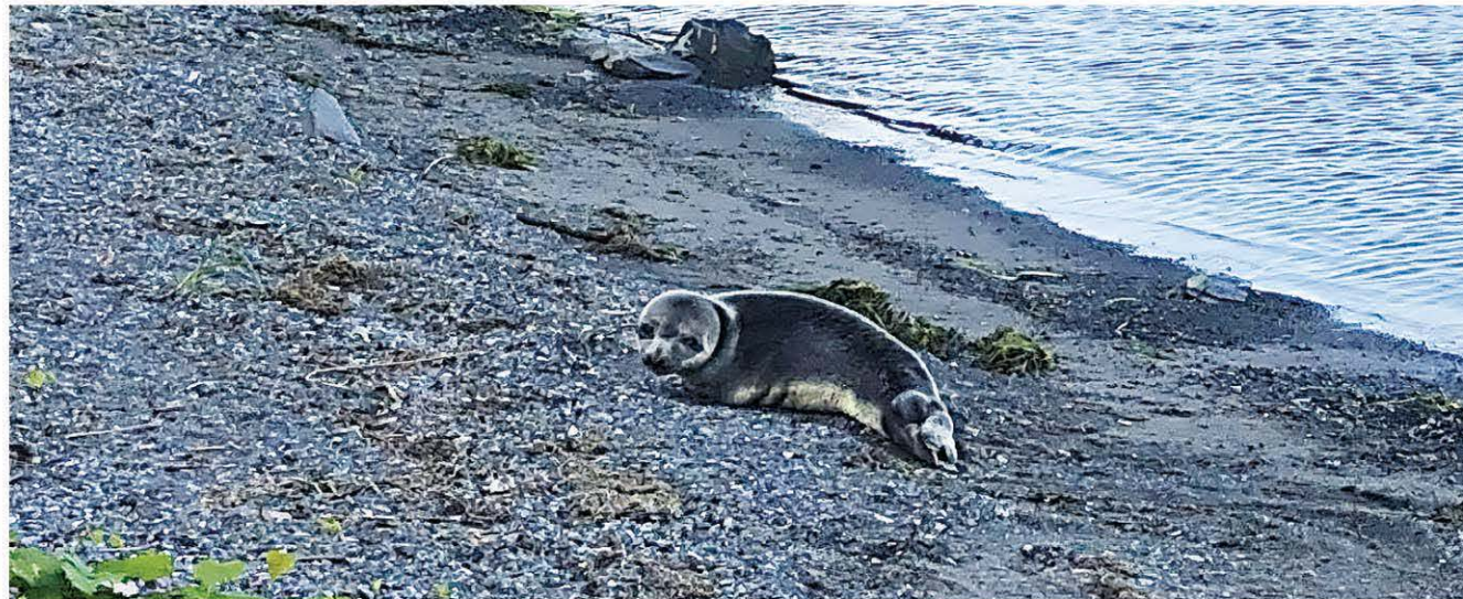
Le phoque à capuchon aperçu à Boucherville a dû être euthanasié quelques jours plus tard.