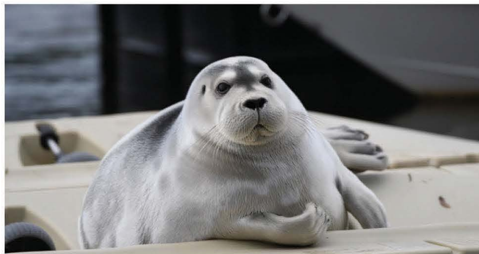
Le printemps dernier, un phoque barbu a également été observé à Laval. Un autre individu de l'espèce avait par ailleurs fait une visite de la rivière Saint-Maurice en 2013.