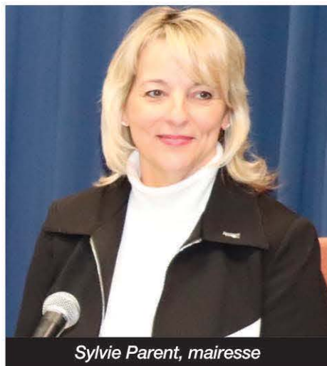
Sylvie Parent, mairesse

« Longueuil fera appel à tous les leviers à sa disposition pour assurer la reprise économique des entreprises et des industries de son territoire, grâce à la mise en œuvre de projets d'infrastructures et de chantiers stratégiques. Nous poursuivrons également nos représentations auprès de nos partenaires gouvernementaux en vue d'obtenir les pouvoirs financiers et politiques supplémentaires qui nous permettront d'accroître