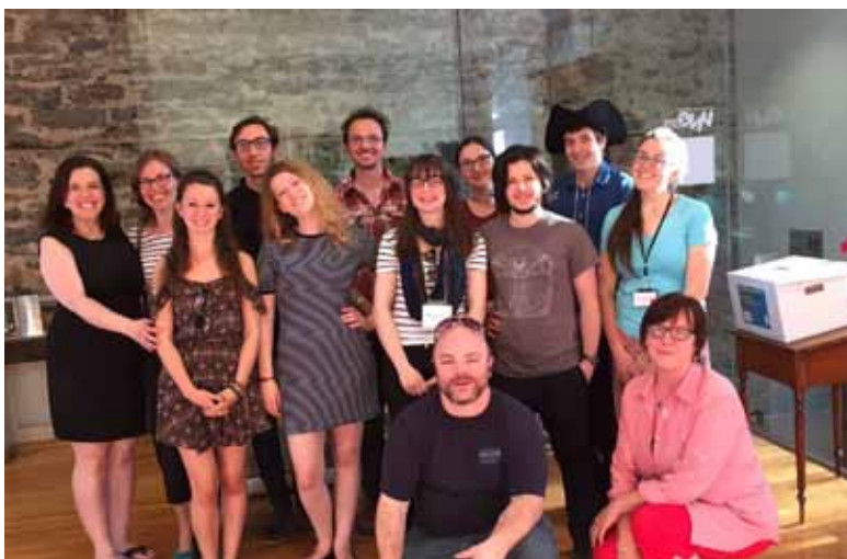
Une partie de l'équipe d'animation et du personnel lors de la Journée des musées 2017.