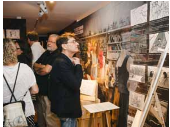
Les invités au vernissage de l'exposition Coup de théâtre : J'ai fondé Montréal !