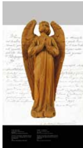
Aperçu de l'approche visuelle de la chapelle aérienne réaménagée.

L'une de nos initiatives stratégiques consistait à élaborer un concept préliminaire pour une nouvelle exposition permanente et à préparer une demande d'aide financière au Ministère de la Culture et des Communications dans le cadre de l' Appel de projets pour le soutien des expositions permanentes . Le concept « Marguerite Bourgeoys : l'audace d'une pionnière », développé par la firme muséologique