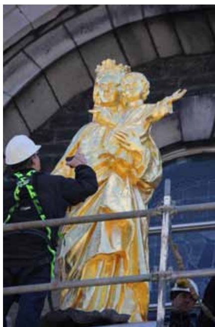
La statue de Notre-Dame-Auxiliatrice a repris sa place d'honneur le 22 avril 2017, non pas sans avoir nécessité des soins les plus attentifs.

Les visites des groupes paroissiaux se sont poursuivies pendant l'année avec les jeunes qui s'inscrivent dans les paroisses pour des parcours catéchétiques. En cette année anniversaire, plus de 300 personnes ont vécu l'expérience de la visite intitulée Ville-Marie : terre d'appel .