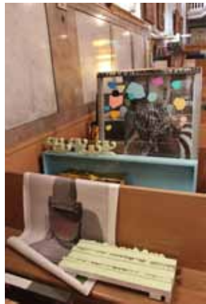
Installation artistique d'Ari Bayuaji à la Chapelle Notre-Dame-de-Bon-Secours.

Notre service a également collaboré à la production d'une exposition temporaire à la Chapelle, conçue par l'artiste multidisciplinaire Ari Bayuaji.