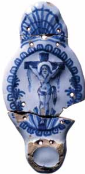
L'un des biens sélectionnés pour le portail Archéolab. Bénitier mural, faïence de Nevers, vers 1750 Collection du Musée Marguerite-Bourgeoys