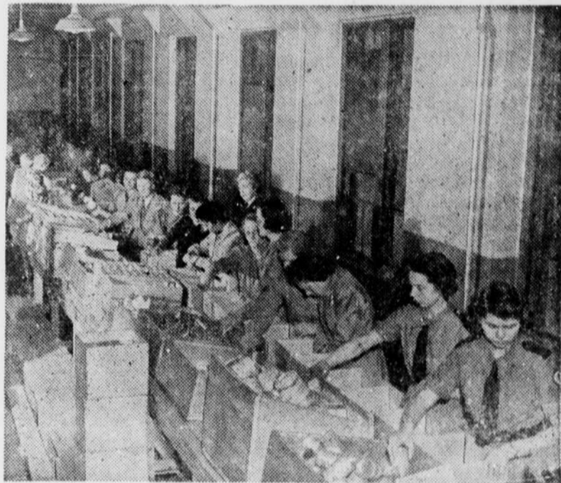
Plus de 47 pour cent du prochain budget de la Croix-Rouge servira à procurer des colis de vivres aux prisonniers de guerre. On voit ici une partie du grand atelier d'emballage de Ville LaSalle, où travaillent des centaines de volontaires.