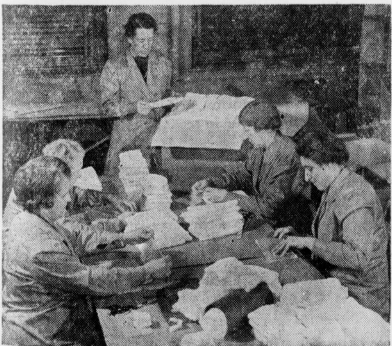
La préparation des pansements chirurgicaux exige beaucoup de soin et d'habileté. On voit ici des bénévoles occupées à ce travail à la Maison de la Croix-Rouge.