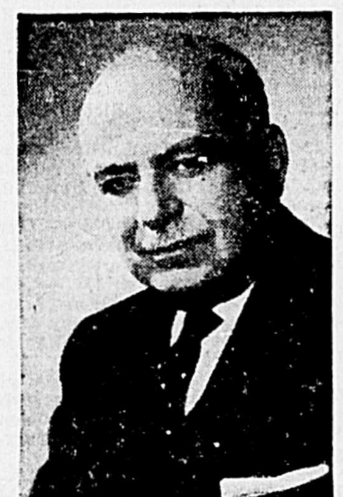
Candidat de l'Union Nationale dans le comté de Chicoutimi