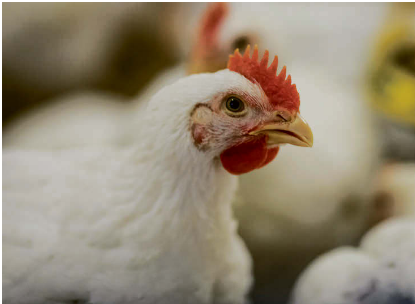
Les volailles de la région sont à risque de contracter la grippe aviaire.

La directrice du secteur vétérinaire pour Boire & Frères, qui fait aussi partie de l'Équipe québécoise de contrôle des maladies avicoles (EQCMA), Linda Lallier, explique qu'il s'agit d'une maladie à déclaration obligatoire qui sévit partout dans le monde. L'important est de la circonscrire, car aucun vaccin n'est disponible contre celle-ci. L'ensemble d'un troupeau doit être euthanasié si on y trouve des cas positifs.