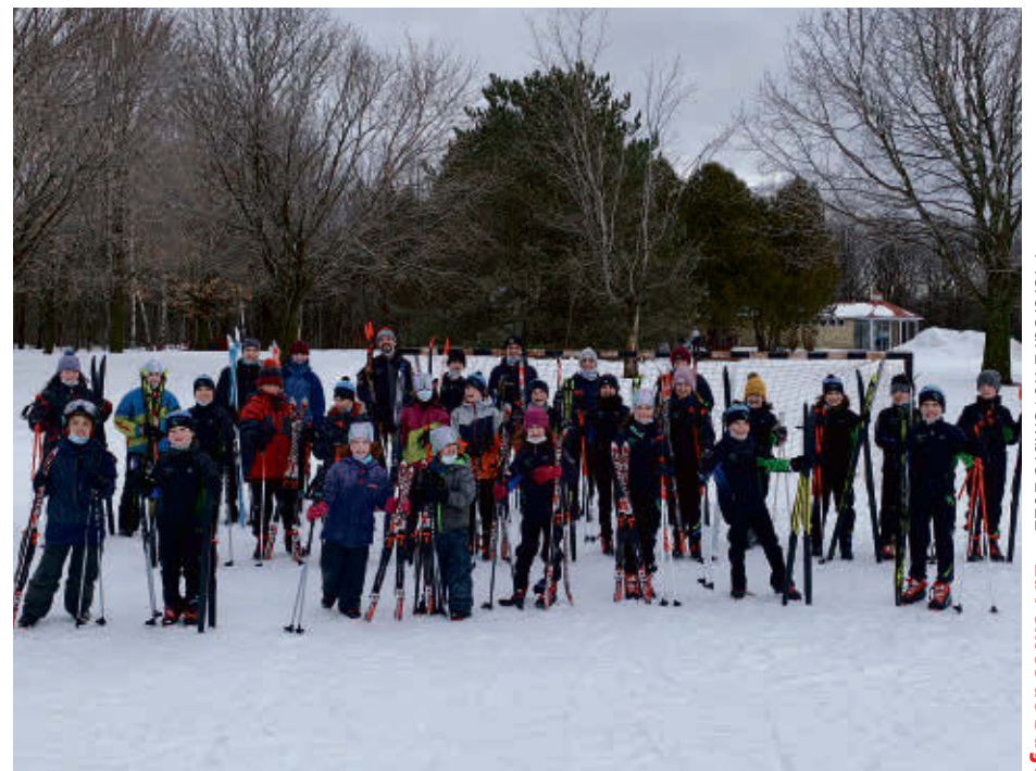
Après avoir connu une excellente saison en 2021-2022, le Club de ski de fond jeunesse de Valcourt est prêt à attaquer la nouvelle saison.

Pour plus d'informations, vous pouvez consulter la page Facebook du Club au www.facebook.com/CSFJVALCOURT/ ou communiquer avec les responsables par courriel au csfjvalcourt@gmail.com .