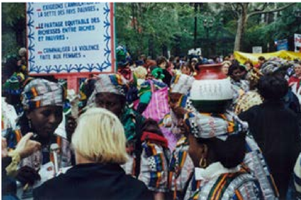
Marche mondiale des femmes de l'an 2000 à New-York

Cette période a été marquée par un vent de développement de la recherche, et par des activités de mobilisation des connaissances inventives qui ont renforcé les fameux liens théorie/pratique. On se rappellera le séminaire sur les nouveaux défis des rapports de sexes , réalisé dans l'autobus menant à New-York pour la Marche mondiale des femmes de l'an 2000 qui réunissait une cinquantaine de chercheuses, d'étudiantes et de militantes, sous la bannière « 2000 bonnes raisons de penser ! » 6 On peut se réjouir aujourd'hui de voir notre approche partenariale inspirer divers milieux de la recherche féministe, comme en témoigne la programmation de colloques nationaux et internationaux, dont le Congrès international des recherches féministes dans la francophonie qui se déroulait à Montréal à la fin août 2015 sous le thème : Penser, créer et agir .