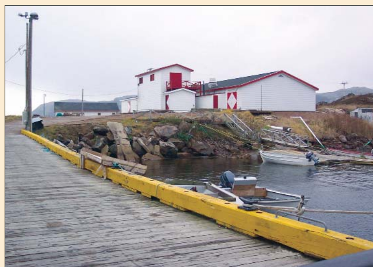
L'usine Fruits de mer de Vieux-Fort (Old Fort Seafood).

d'ailleurs appuyé financièrement le nouveau propriétaire pour le redémarrage cette usine. Fort du succès remporté pendant cette première année de rodage, M. Dumaresque prévoit doubler sa production en 2006 en accentuant l'exploitation des mêmes espèces auxquelles, si possible, il en ajoutera d'autres tel le concombre de mer.