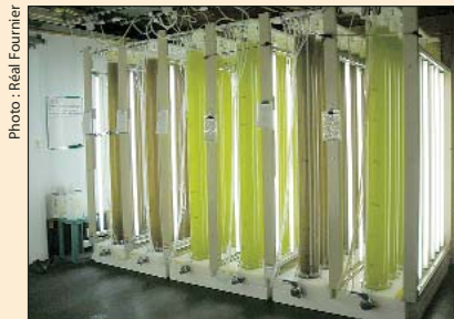
Une partie des installations pilotes de production de micro-algues à l'ISMER.

Quand les enfants s'émerveillent devant les invertébrés à l'Aquarium de New York et de Québec, ils sont certainement loin d'imaginer que ces animaux marins doivent leur vitalité à une nourriture soigneusement concoctée pour eux à Rimouski. L'usine pilote aménagée à la Station aquicole de l'ISMER par Réal Fournier fonctionne à plein régime pour produire des micro-algues qui sont déjà utilisées dans trois aquariums en Amérique du Nord. Elle a été implantée dans le cadre d'un projet soutenu par Gestion Valeo, société en commandite chargée de la valorisation des résultats des recherches de l'UQAR, en collaboration avec cinq partenaires financiers, dont le MAPAQ. Les résultats obtenus jusqu'à maintenant sont intéressants : des prototypes industriels performants, un procédé de production et de concentration des micro-algues optimisé, des coûts de production connus. Les tests de marché ont révélé que les aquariums constituaient le marché le plus prometteur pour ce produit. C'est donc sur celui-ci de même que sur celui des éclosiers commerciaux de mollusques et de poissons que misera, au cours de ses premières années d'exploitation, l'entreprise qui sera créée sous peu pour poursuivre la production.