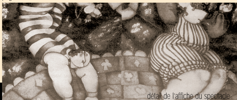
détail de l'affiche du spectacle