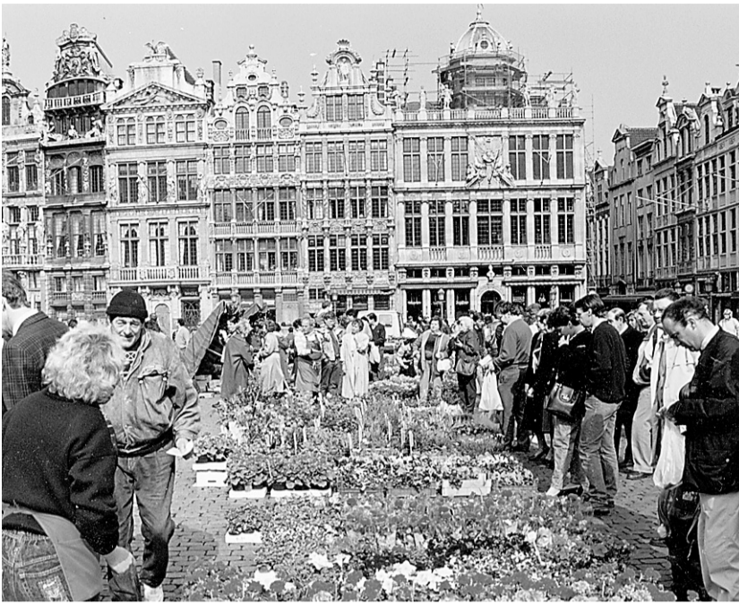
La Grand-Place de Bruxelles. La capitale belge peut constituer une base idéale pour découvrir d'autres endroits situés à moins de deux heures de route.

Vacances Transat, qui commercialise des vols nolisés vers Bruxelles, propose un forfait qui inclut l'avion, sept nuits d'hôtel et trois excursions (Bruges, Anvers et Amsterdam) pour environ 1450$ par personne, en septembre. Procurez-vous leur brochure Europe dans une agence de voyages. Un vol d'Air Transat vous coûtera 850$ par personne, taxes incluses, pour un départ du 22 septembre et un retour du 7 octobre.