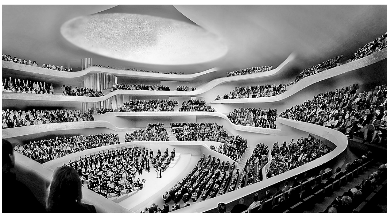
La salle de concert projetée pour Hambourg, qui devrait permettre d'attirer le regard et l'oreille de l'étranger.

Il abritait le cacao, le tabac et le thé livrés par les cargos d'alors.