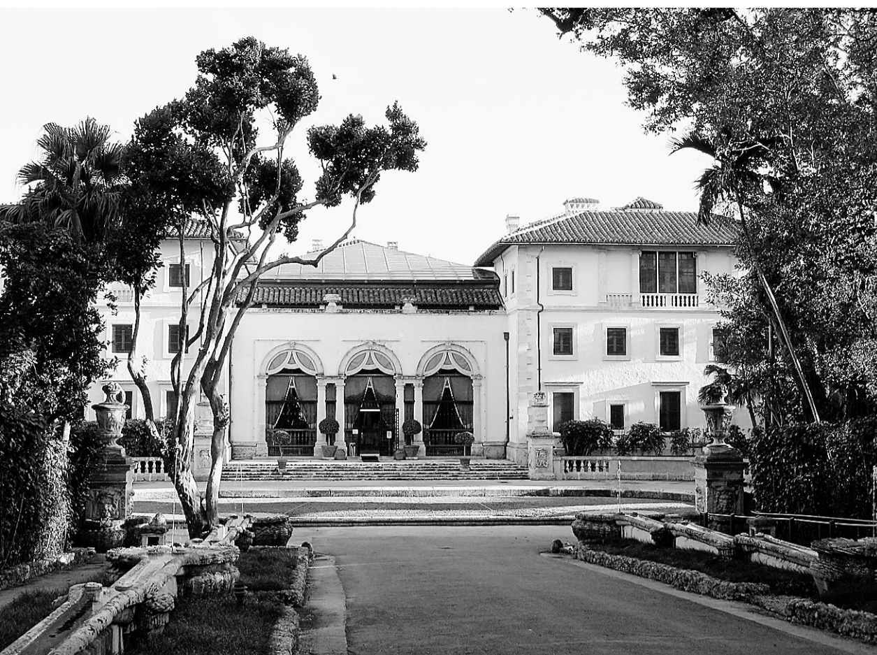
La Villa Vizcaya, à Miami en Floride, n'a rien à envier aux châteaux et aux villas des familles princières européennes. Il est enchâssé au milieu de jardins à la française agrémenté d'une belle collection de sculptures comme le montre la photo à droite.