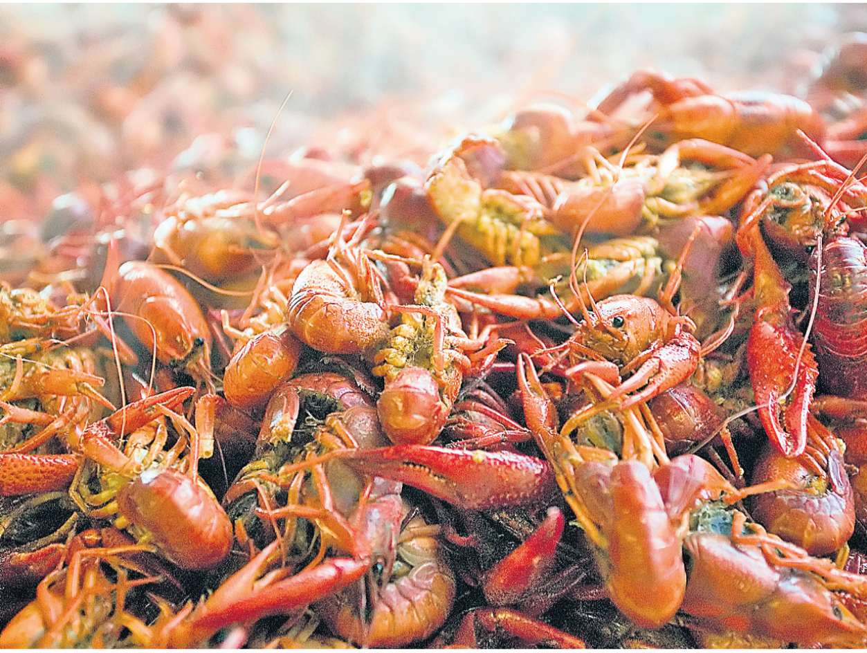
Les écrevisses sont populaires en Louisiane, et souvent servies dans une eau fortifiée de grains de poivre, de bâtons de cannelle et parfois d'une sauce épicée.