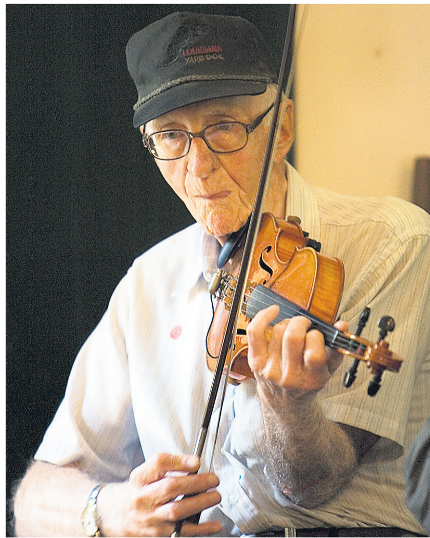
Un vieil homme joue du violon dans le village de Vermilionville.