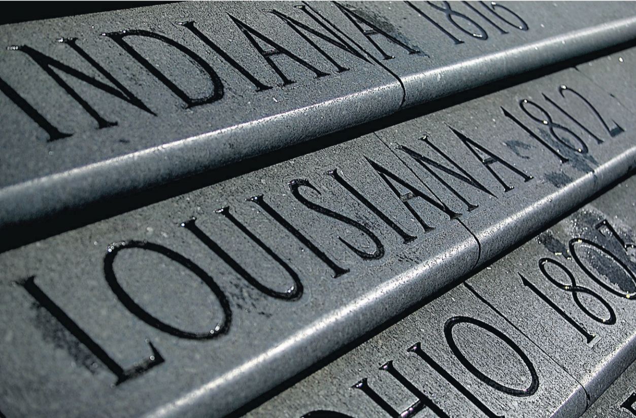
Le nom de chaque État américain, ainsi que la date de son entrée dans l'Union, sont gravés dans les marches du Capitole de la Louisiane, à Baton Rouge.