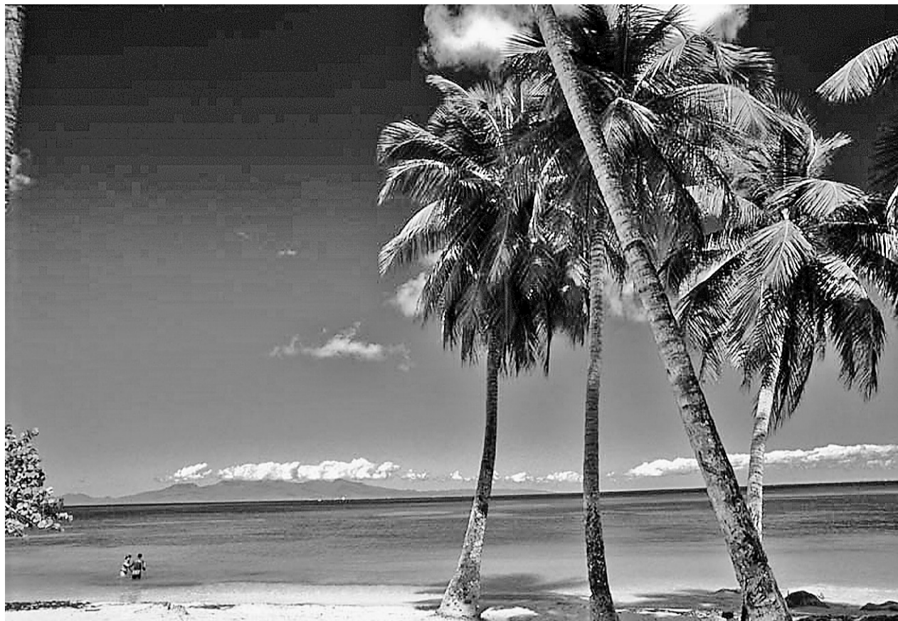
La plage Saint-Louis, dans l'île Marie-Galante.

« On compte un peu plus de 10 000 habitants dans l'île. Pourtant, les routes sont presque désertes, les rares places publiques jamais encombrées. Et comme pour s'y rendre, il faut prendre le bateau de Pointe-à-Pitre, la capitale de la Guadeloupe, le