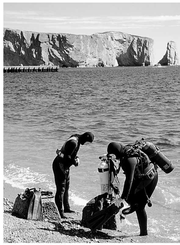
Autour du rocher Percé et de l'île Bonaventure, on trouve plusieurs beaux lieux de plongée.

9 GEORGEVILLE Deux douzaines de lieux de plongée intéressants sont répertoriés dans les eaux du lac Memphrémagog, aux alentours de Georgeville. En plus de Memphré, le légendaire monstre lacustre, plusieurs belles falaises englouties caractérisent ce grand lac des Cantons-de-l'Est.