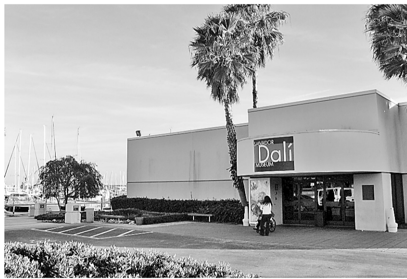
Le musée Dali à St. Petersburg, exclusivement consacré à l'œuvre de Salvador Dali, partage, avec le Ringling Museum de Sarasota, le titre du musée le plus visité de Floride.