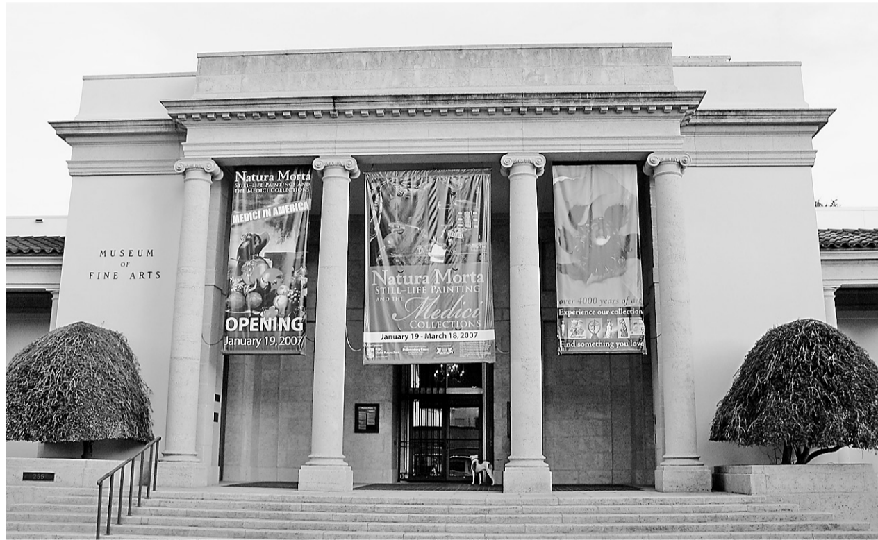
En bordure de la baie de Tampa, le Musée des beaux-arts de St. Petersburg expose une belle collection d'impressionnistes et de sculpteurs français, avec ses Monet, Cézanne, Gauguin, Renoir, Morisot, Rodin et autres Bourdelle.

Or, stucs, plafonds à caissons, marqueteries, mosaïques, bas-reliefs, sculptures... l'ensemble n'a rien à envier aux châteaux et aux villas des familles princières européennes. Il est enchâssé au milieu de jardins à la française agrémenté d'une belle collection de sculptures.