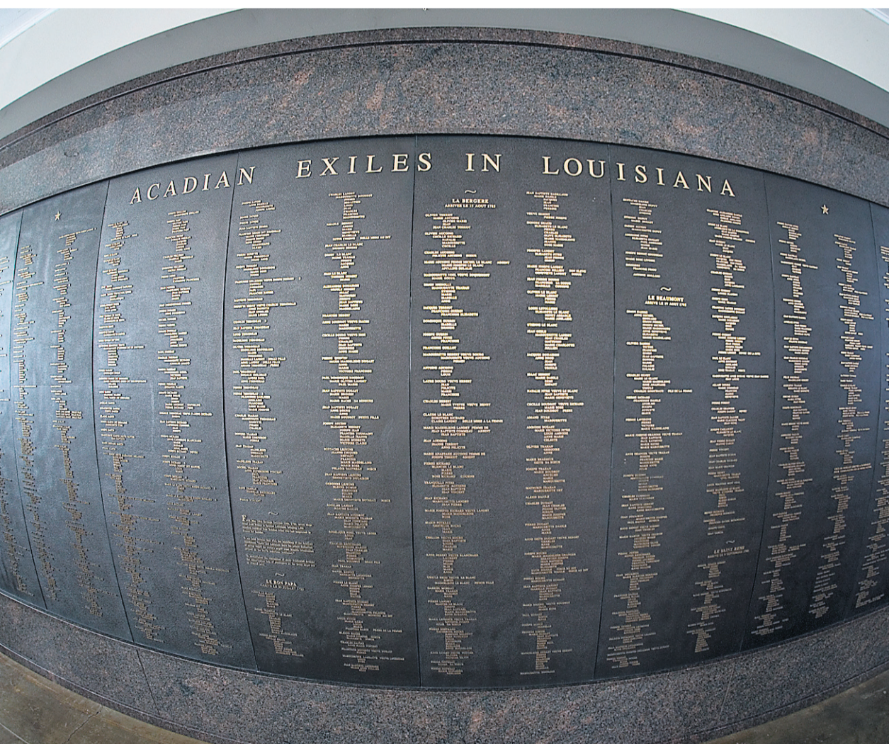
À Saint-Martinville, une plaque énumère les noms des Acadiens déportés qui se sont retrouvés en Louisiane.