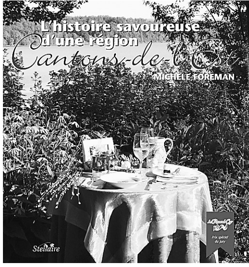
On trouve dans le livre autant l'histoire régionale et agricole de la région que des bonnes adresses où s'arrêter et des portraits de producteurs et de chefs.

Cantons-de-l'Est, collection L'histoire savoureuse d'une région, Michèle Foreman, Éditions Stellaire, 127 pages, 24,95 $