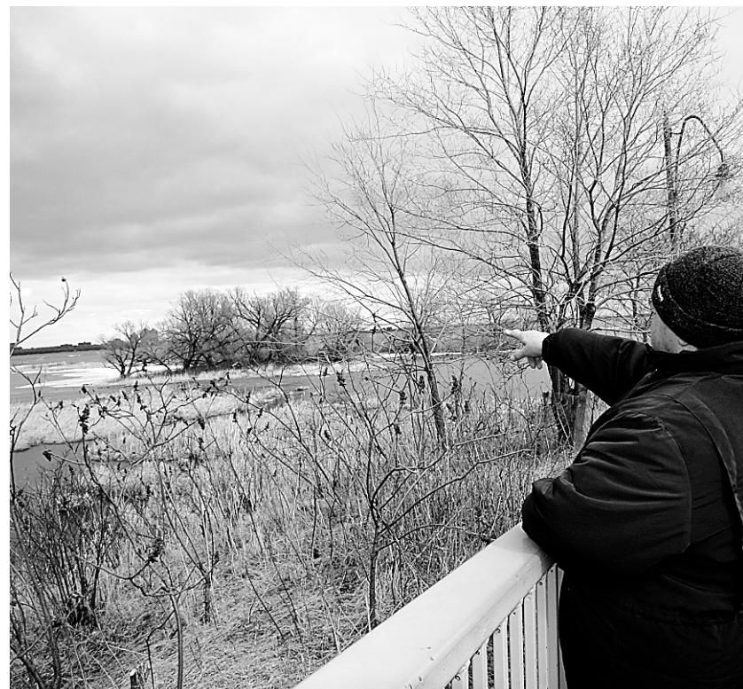
Les sentiers agréablement aménagés présentent un accès direct aux spectaculaires rapides de Lachine.

Le parc des Rapides est accessible par la 6 e Avenue, à LaSalle. De ce point de départ, on peut parcourir, à pied ou à vélo, une centaine de kilomètres de pistes urbaines. Les marcheurs peuvent se diriger directement sur la jetée des rapides, qui couvre à elle seule cinq hectares.