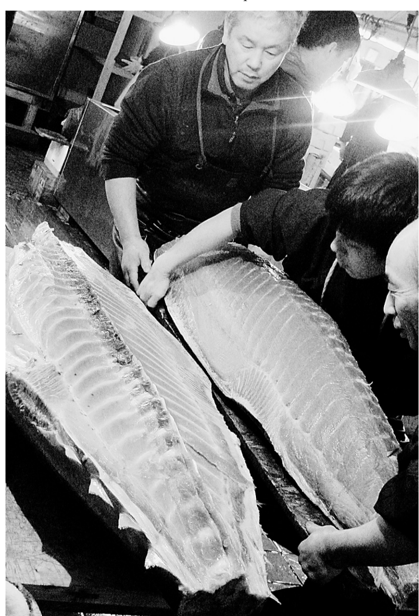
Des 450 espèces de poissons, coquillages et crustacés qu'on trouve au marché Tsukiji, la plus convoitée est certainement le thon rouge du Pacifique.

*Le nombre de chambres offertes pour cette offre est limité. Les économies sont calculées par rapport au prix régulier du même forfait. Les billets sont valides pour un parc thématique par jour et doivent être utilisés au cours des 14 jours suivant leur première utilisation. Les tarifs de groupe et autres rabais ne sont pas applicables.