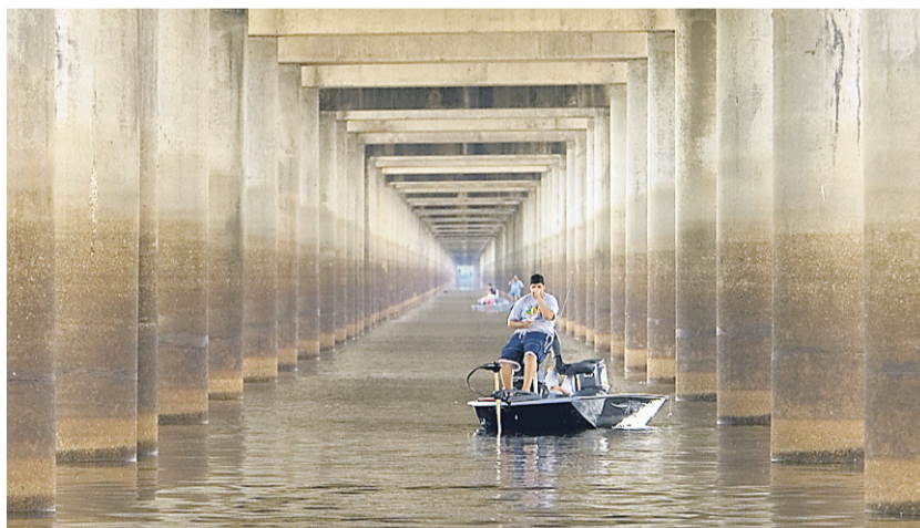
Un homme pêche sous les piliers de l'autoroute qui traverse le bassin Atchafalaya.

Plusieurs musées relatent l'épopée acadienne et rendent hommage à ces courageux survivants de la déportation de septembre 1755, le Grand Dérangement.