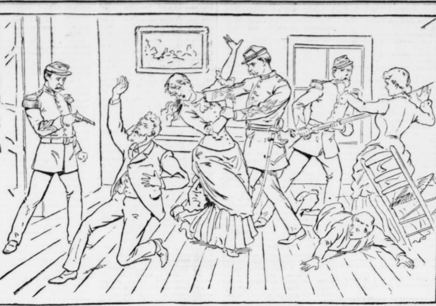
Les prières de César massacrèrent sans pitié cette malheureuse famille.

En face de la chambre et comme en plus sur le haut des murailles; en larges gouttes et en larmes rouges plus bas, le long des boiseries, des meubles renversés, éventrés, béants; en plaques sombres et en ruisseaux qui formaient un lacis hideux, sur le parquet.