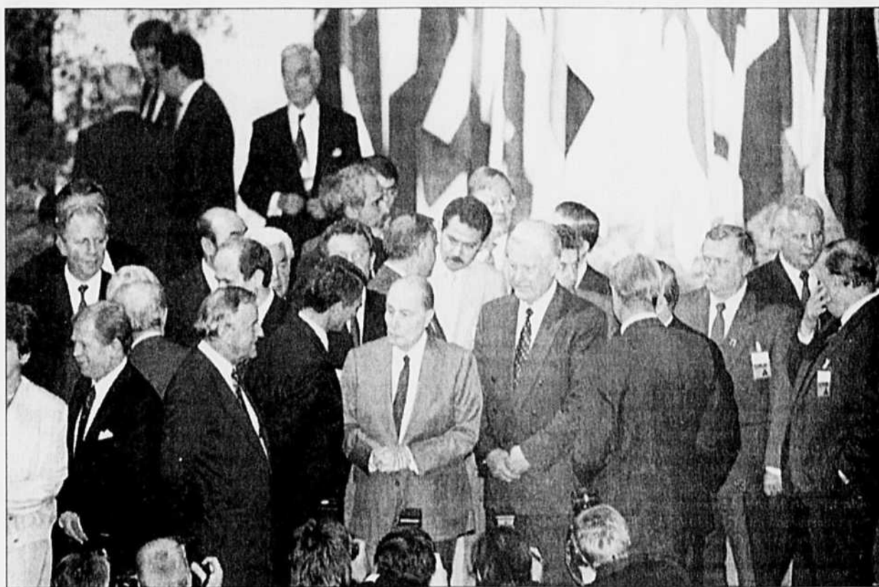
On constate que l'Occident est en train de se réorienter dans la crise yougoslave actuelle où les intérêts de la France, de la Grande-Bretagne et de la Grèce sont en opposition directe avec ceux des États-Unis, de l'Allemagne, de l'Italie et de la Turquie.

Ainsi, derrière la question de la protection de l'aide fournie par les Nations Unies aux musulmans de l'ancienne Yougoslavie, se cache le nouveau format de l'«Ordre Mondial», au moins dans le cas européen. Actuellement, ce nouveau format n'inclut pas les Américains — en réalité leur intérêt dans l'imbroglio balkanique n'est pas influencé que par l'opinion publique et par les médias d'information — et les Russes qui sont profondément préoccupés par leurs problèmes intérieurs. En tout cas, jusqu'à maintenant la Russie essaie de faire avancer la stabilité politique des pays membres de la communauté des États indépendants dans l'espoir qu'un jour, ces États s'intégreront à une nouvelle Russie. Pour sa part l'administration américaine essaie de consolider l'intégrité de ces nouveaux États qui pourraient dans l'avenir devenir une zone tampon et ainsi limiter les