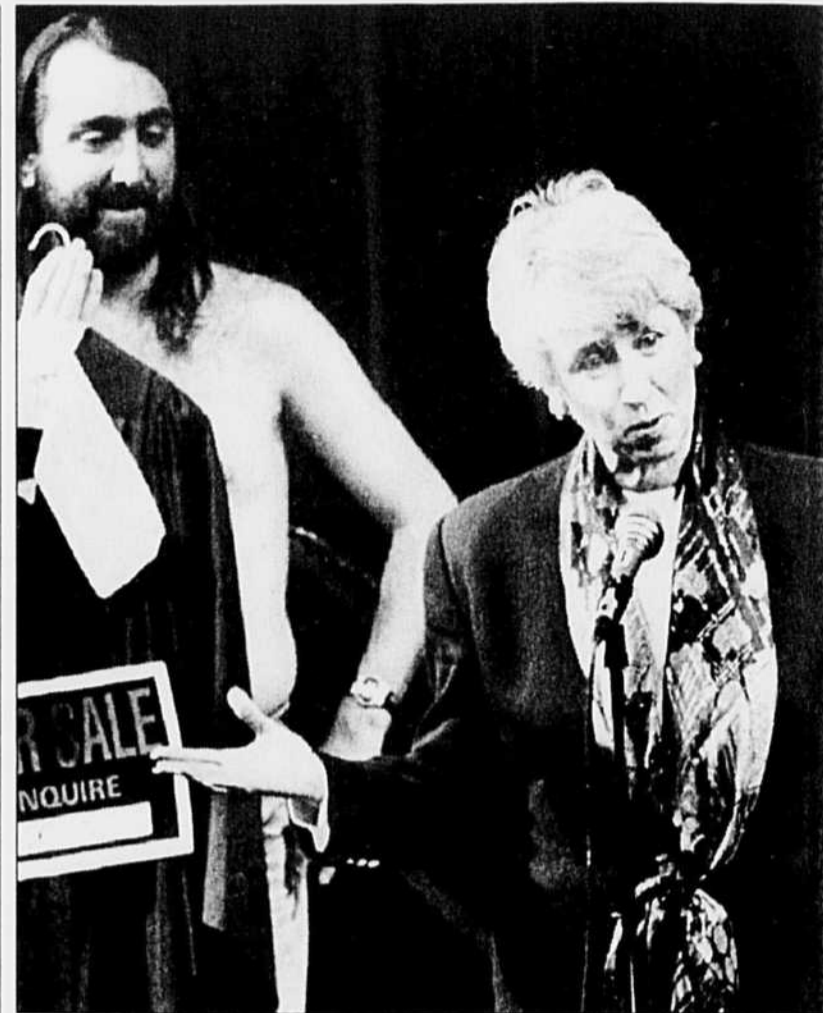
Kim Campbell a été battue par K.O. aux dernières élections. Elle en riait hier matin, à Vancouver, dans le cadre d'une émission de télé humoristique.

Au cours des prochains mois, le secteur public et parapublic orientera sa lutte vers la loi 198. Globalement, celle-ci prévoit une réduction des effectifs de 12% chez le personnel syndiqué d'ici 5 ans et de 20% des cadres d'ici 3 ans. De rudes combats pour la sécurité d'emploi sont à prévoir.