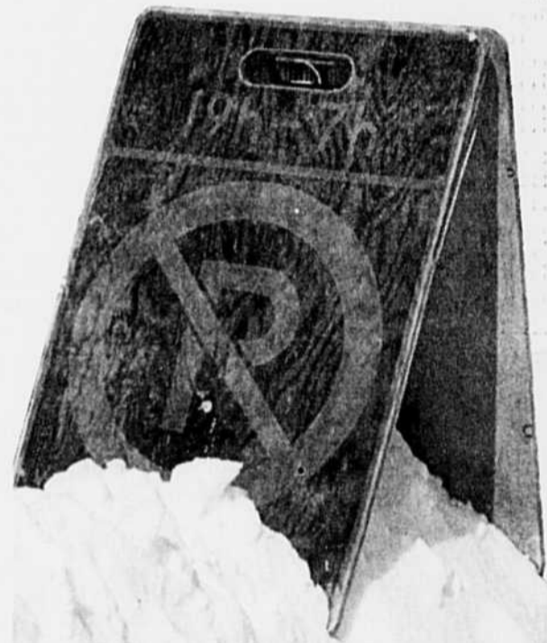
La Ville compte réaliser un certain nombre d'économies en éliminant notamment l'utilisation de ces panneaux indicateurs.

«C'est une révision complète des méthodes de travail qui vise notamment la réduction des coûts et la protection de l'environnement», indique Mme Ellefsen des travaux publics. L'une des avenues qui pourrait être envisagée est de repousser la neige en bordure des chemins dans les rues résidentielles ou l'espace le permet.