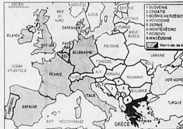
Les signataires du Sommet d'Helsinki s'étaient mis d'accord pour respecter les frontières existantes en Europe.

Les Européens, eux, semblent l'avoir compris. Ils sont en train d'établir des bases de pénétration économique dans cette région. Devant l'absence russe et américaine, ils pourraient en tirer des profits financiers considérables. Cependant, cette course pour le contrôle des marchés asiatiques a créé une compétition parmi ces mêmes Européens dont on peut sentir les échos dans le carnage yougoslave.