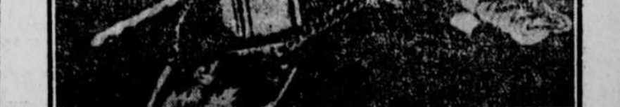
Le prince héritier FREDERIC GUILLAUME, dont l'armée est en très mauvaise posture.

Un des plus intéressants et pathétiques spectacles de ces jours derniers fut l'organisation des trains chargés du transport des bébés de régions envahies de France et de Belgique. Les petits voyageurs étaient accompagnés d'infirmières et de jolis petits lits ont été installés dans les voitures. Les bébés semblent se réjouir, car on les emmène dans le midi, loin du bruit des canons et des mitrailleurs.