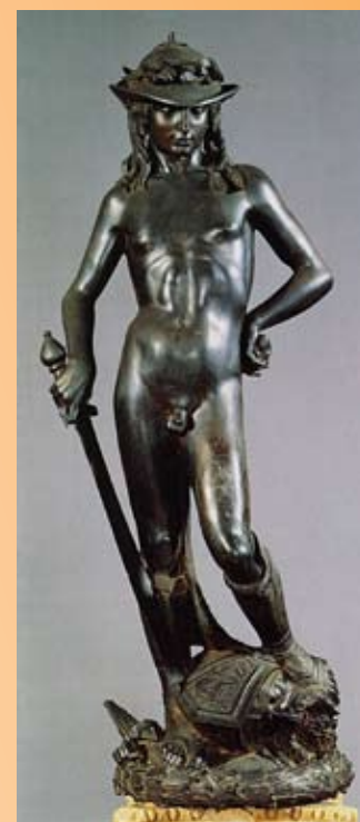
Le David de Donatello.

homoérotiques de la Renaissance, malgré le climat très intolérant qui s'est mis en place dès le XVI e siècle. Aussi estimons-nous chanceux de vivre à une époque et dans un endroit où l'on fait peu de cas de l'homoérotisme dans l'art. Espérons seulement qu'un nouveau Savonarole trop épris de la culture judéo-chrétienne (Harper, Ratzinger ou autres) ne vienne pas changer la situation favorable actuelle.