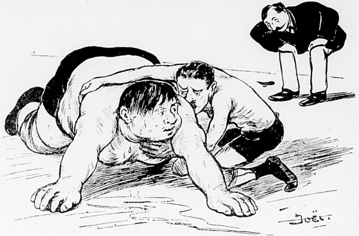
LA LUTTE POUR LA VIE.

—Laisse-toi tomber et je te donne $100.00. —Pas capable, suis trop fatigué pour me r'virer sur le dos.