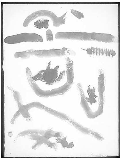
Sans titre(1954), d'Ulysse Comtois.

même époque qui est proposée. À la découverte du Paradis : le Pacifique-Sud avec Cook et Bougainville réunit deux navigateurs avec plus d'un point en commun. Car autant James Cook (1728-1779) que Louis-Antoine de Bougainville (1729-1811) auront exploré les mêmes mers, ils auront dans leur trentaine bataillé en Nouvelle-France. Au menu : journaux personnels, instruments scientifiques et même des tableaux de Gauguin, qui a aussi cherché le paradis en Tahiti. (Circuit violet).