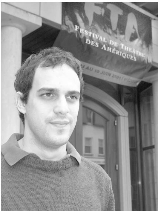
Le jeune auteur et metteur en scène argentin Federico Leon.

Si le point de départ était de parler de l'absence du père, la pièce insiste beaucoup plus