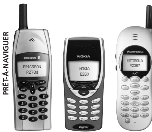
Une vaste gamme d'appareils numériques

Visitez le www.rogers.com/sans-fil , composez le 1 800 IMAGINE ou rendez-vous chez nos distributeurs Rogers MC AT&T MD participants.