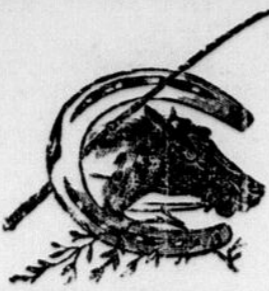
COURSES SUR LA GLACE

Il y a déjà assez longtemps que nous n'entendions plus parler de courses de chevaux à Rivière-du-Loup où ce fut pourtant jadis un des sports favoris. C'était à se demander si la voiture à cylindres n'en avait pas fait perdre la vogue à jamais. Mais non, le goût en était resté au fond des coeurs et il a suffi d'un ennui passager, le rationnement de l'essence, pour faire réapparaître, comme au bon vieux temps, d'élégants coursiers dans les rues de notre ville. Malheur est bon parfoils.