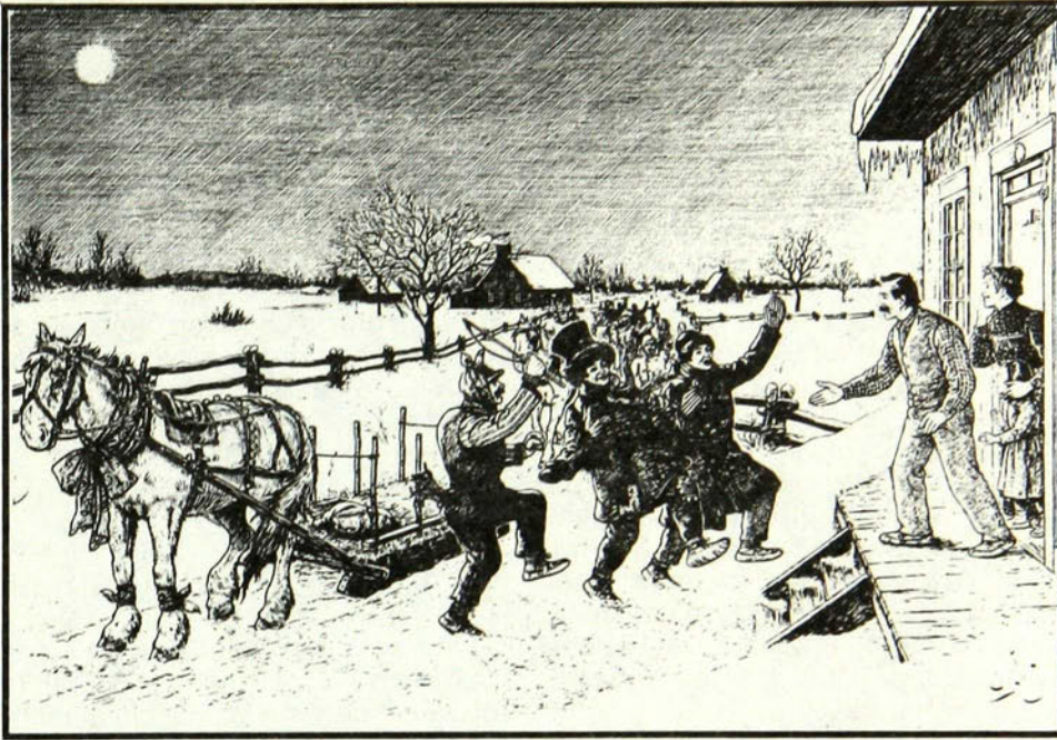
LE MARDI GRAS À LA CAMPAGNE. — Composition d'Edmond-J. Massicotte.

Lorsque j'ai fait la découverte de cette section de la bibliothèque qui s'appelle Documents spéciaux, j'ai été transportée dans un monde aux images passées et aux couleurs anciennes qui m'ont donné la sensation d'avoir vécu ces époques difficiles mais aussi fascinantes de nos ancêtres.