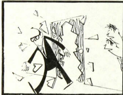
LE MAIRE — Qui a dit que je manquais de fermeté? Tiré de Vrai , décembre 1955