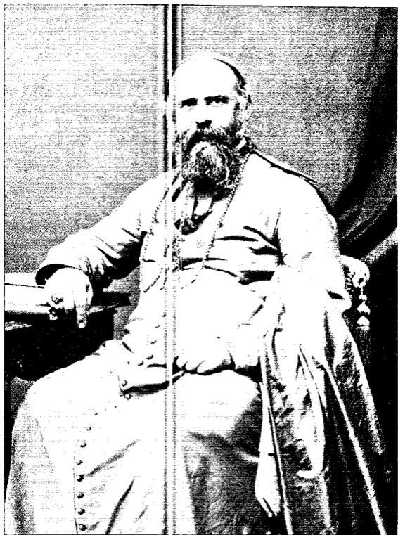
MONSIEUR COMBONI, Vicaire Apostolique de l'Afrique Centrale.