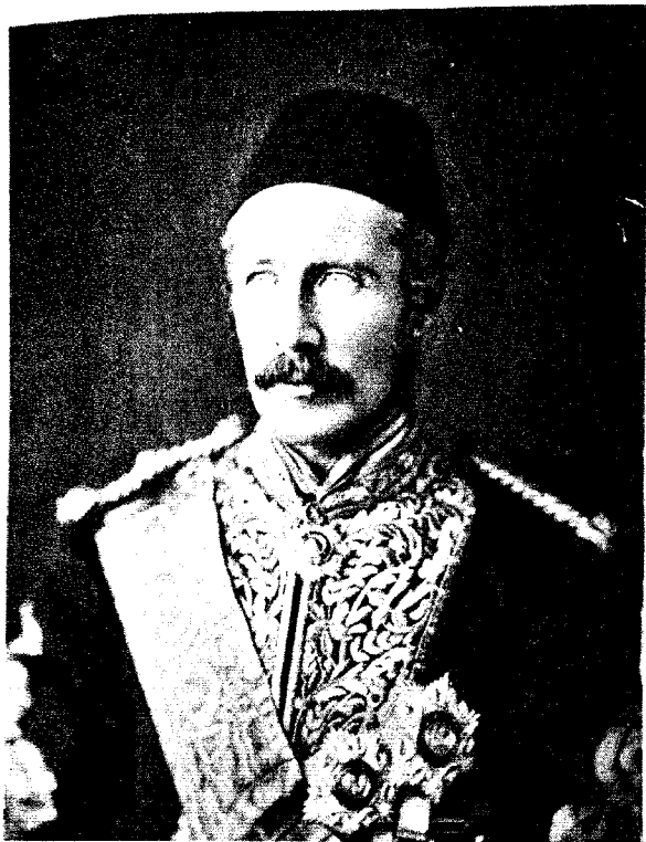
LE GÉNÉRAL GORDON, Gouverneur de Khartoum.