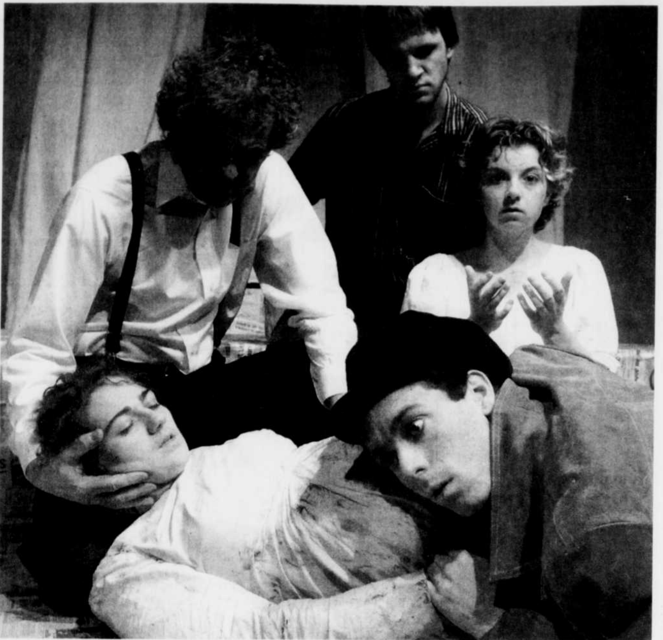
La distribution des Treize pour Les mains d'Edwige au moment de la naissance: un récit noir transmuté par de fortes images poétiques.

Les billets pour cette pièce de théâtre sont en prévente au coût de 10 $ sur le réseau Billetech (service et taxes en sus). À la porte, les soirs de représentation, le coût sera de 12 $.