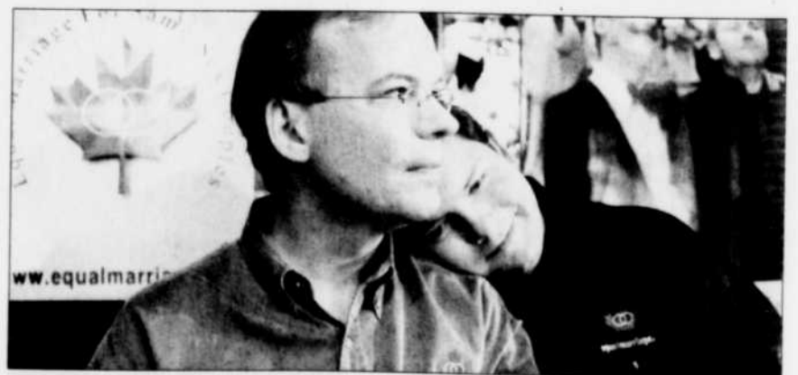
Jeudi, la Cour suprême a jugé constitutionnelles les unions entre personnes de même sexe.

Le mariage entre conjoints de même sexe a reçu l'approbation de la Cour suprême du Canada. Je n'y vois aucune attaque contre «la famille». L'époque où l'homosexualité était considérée comme une maladie mentale, un crime ou un péché tend à disparaître avec l'avancement des connaissances. Or, il se trouve encore des gens qui s'opposent au mariage de personnes de même sexe. Parmi elles, plusieurs préféreraient que les règles de leur