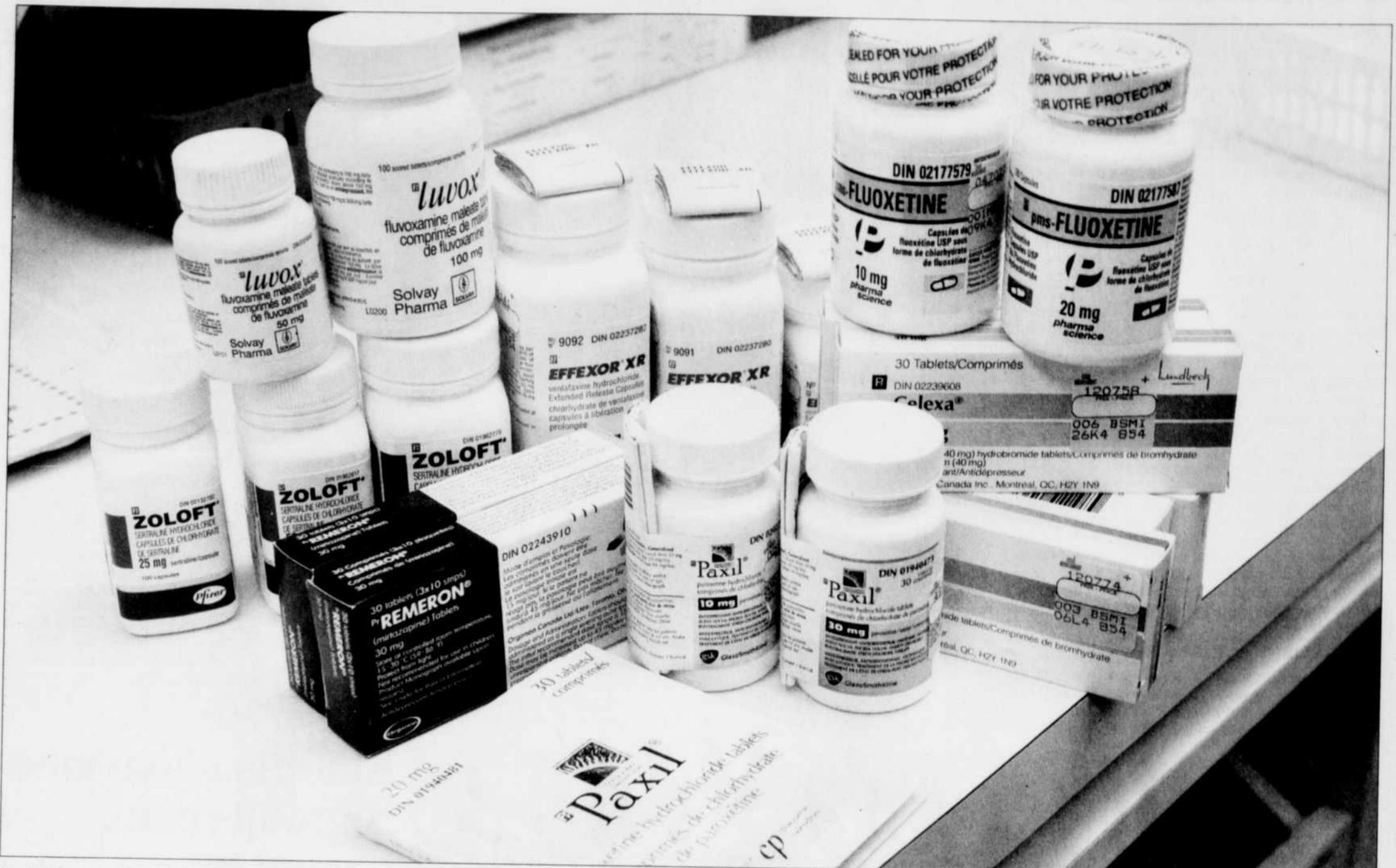
Les Québécois ont fait remplir 2,5 millions d'ordonnances d'antidépresseurs en 1999 et 5,1 millions en 2003, soit une augmentation de 104 % en quatre ans.

◀ L'EXCELLENCE SELON UNE JEUNE FEMME ENGAGÉE : CATHERINE BÉDARD D 3 VASTEL : MARIAGE GAI, PLANCHE DE SALUT OU PATATE CHAUDE ? D 5