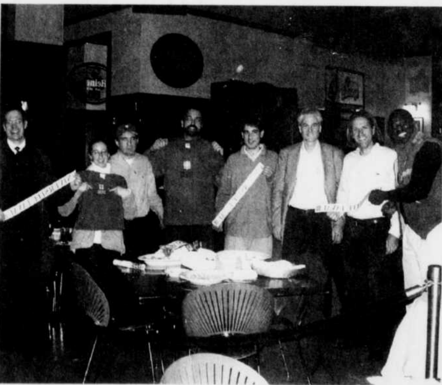
Des membres du Club des diplômés de San Francisco se sont réunis pour souligner la Journée de l'appartenance à l'Université Laval.

prochain. Nous verrons alors à ce que les activités soient encore plus étendues et diversifiées, multipliant ainsi les occasions pour les diplômés de participer et de se transformer pour l'occasion en fiers ambassadeurs de notre Université.»