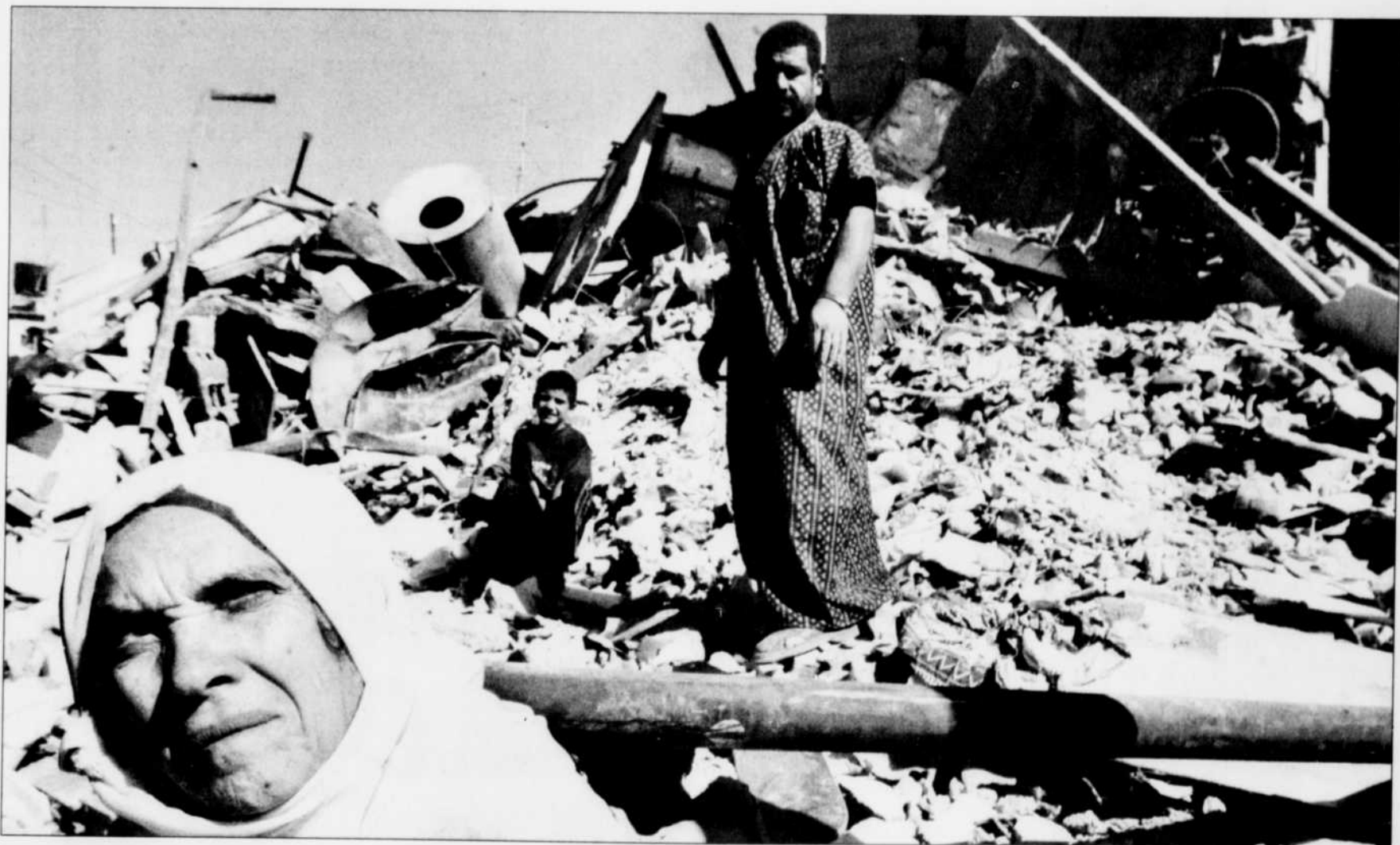
Le paysage palestinien est désolant à la suite de la démolition des maisons des volontaires de la mort.

Le cas de Gaza est encore plus désespérant. L'économie de cette bande aride connaît la pire récession de son histoire. Le chômage y est endémique. C'est dans ses pépinières que se recrutent contrebandiers et activistes des organisations islamistes radicales. La Banque mondiale prévoit