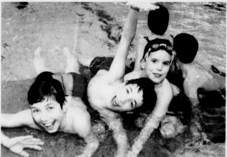
Pour les parents et enfants, des bains récréatifs avec jeux gonflables sont toujours offerts les samedis et dimanches de 14 h à 15 h 50.

Plusieurs activités libres seront accessibles durant cette période. Les visiteurs pourront s'adonner à l'une ou l'autre des activités suivantes: baignade