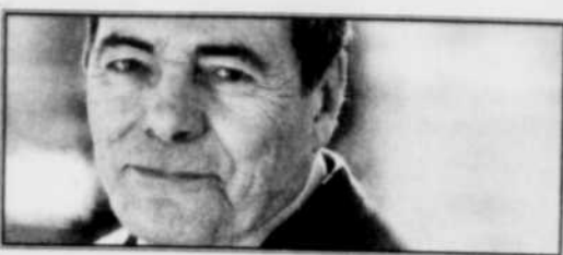
Planche de salut ou patate chaude ?