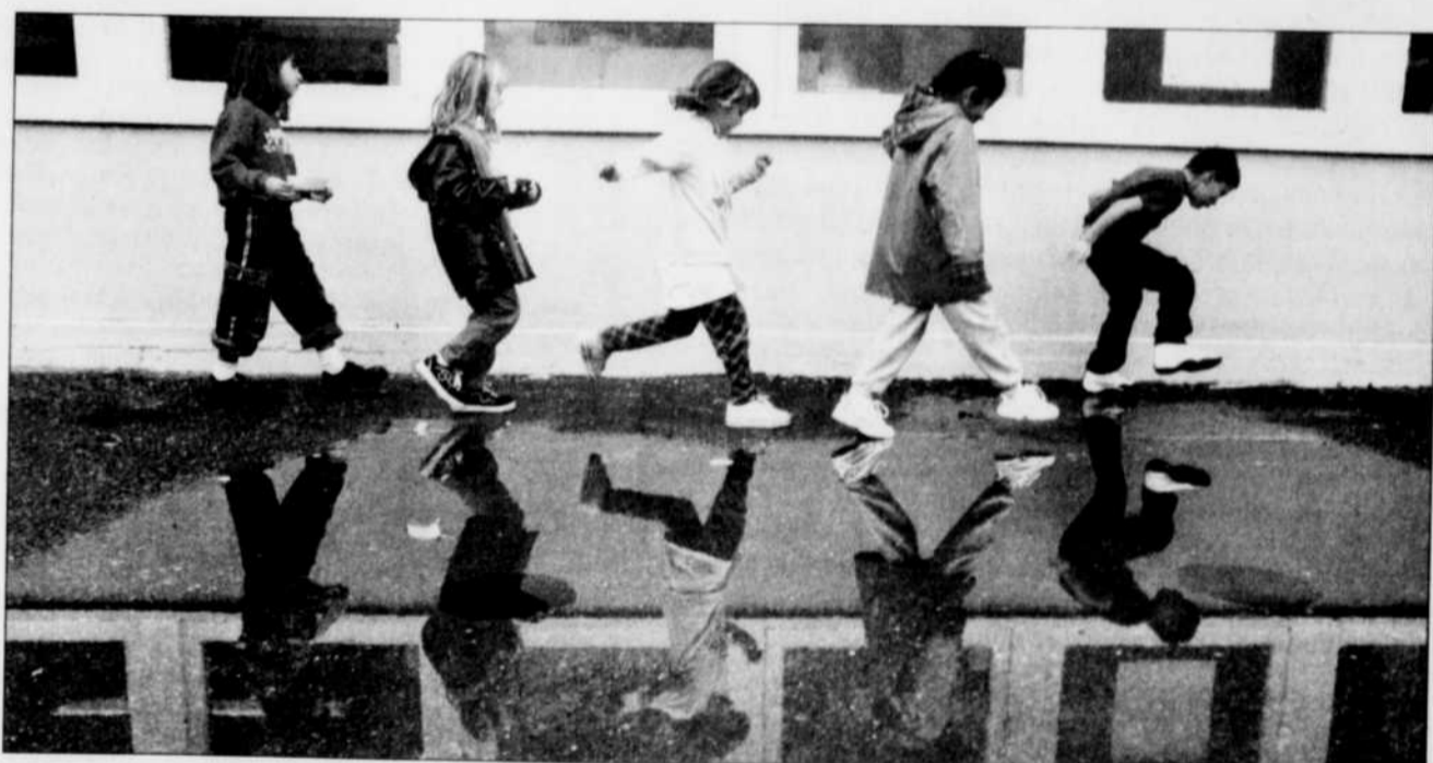
En faisant des partenariats avec la communauté, les commissions scolaires espèrent rehausser les services à la population et, dans le meilleur des mondes, limiter les fermetures d'écoles.

Pourquoi si vite? Parce que le modèle pourrait mettre un point final aux menaces de fermetures. Cette année seulement, les commissions scolaires devront composer avec 13 000 têtes de pipe en moins, et elles ont déjà prévenu qu'elles ne pourraient pas assurer le status quo très longtemps. À la commission scolaire de la Capitale, on affirme qu'on a d'abord projeté ces services pour rehausser les performances scolaires des petits. Mais les commissaires ne sont pas sans savoir qu'il s'agit d'un intéressant moyen de trouver de l'argent neuf pour financer les établissements désertés. Après tout, si les gymnases de la future école Saint-François d'Assise sont utilisés par la Ville de