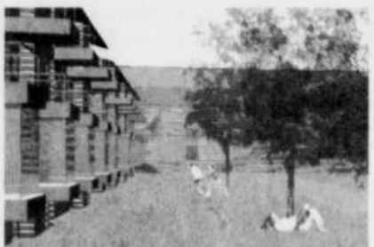
Perspective de la cour centrale d'un îlot résidentiel du projet de la CADEUL.

Dans son étude de faisabilité, la CADEUL propose de construire de nouvelles résidences dans le secteur nord-est du campus, en bordure du chemin Sainte-Foy, entre le PEPS et la rue Myrand. La première phase du projet pourrait permettre de loger près de 115 personnes, ou près de 200 personnes, dans trois ou cinq bâtiments de quatre étages, selon les résultats d'une analyse de rentabilité à venir. Trois appartements sur cinq, soit 60 % du parc locatif, comprendraient deux chambres. Les logements d'une et de trois chambres compteraient respectivement pour 20 % de l'ensemble.