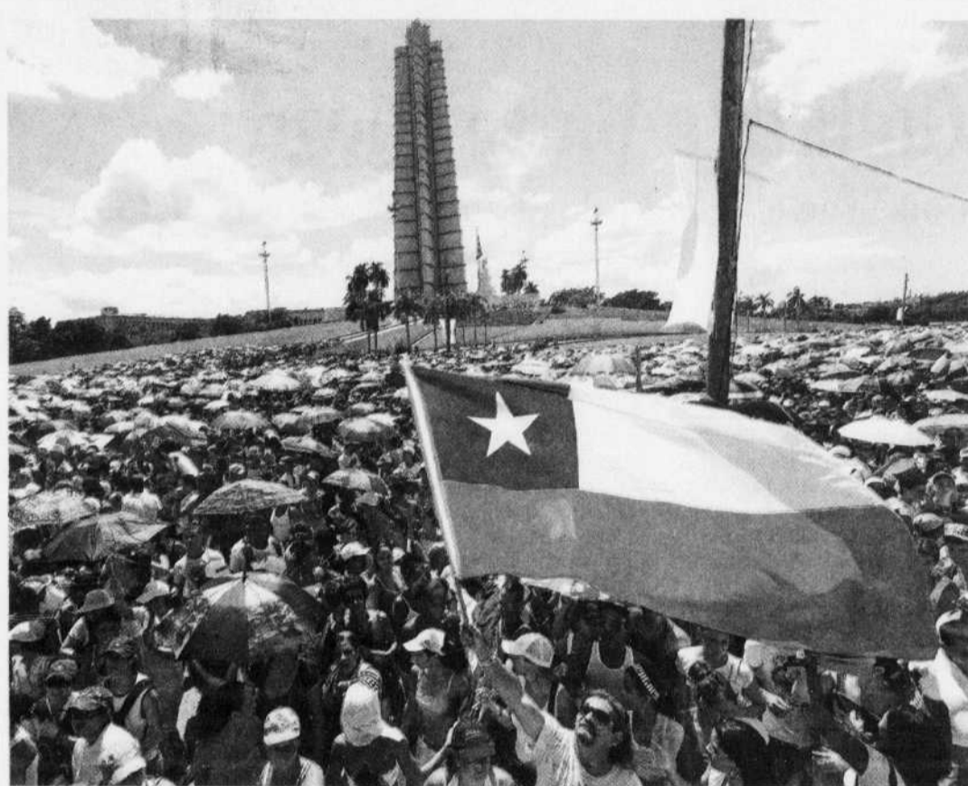
Un homme brandit un drapeau chilien au concert Concert pour la paix du chanteur Juanes.