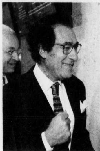
Le ministre de la Culture égyptien, Farouk Hosni, reste le favori.

Tous les candidats peuvent se maintenir de tour en tour sauf à l'issue du quatrième, pour lequel ne se qualifient que les deux candidats arrivés en tête.