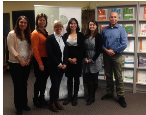
Délégation de la Police Nationale de la Norvège à Montréal

Du 27 au 31 octobre 2013, le CIPC a reçu deux gagnants de deux bourses de prévention de la criminalité de la Police Nationale de la Norvège.