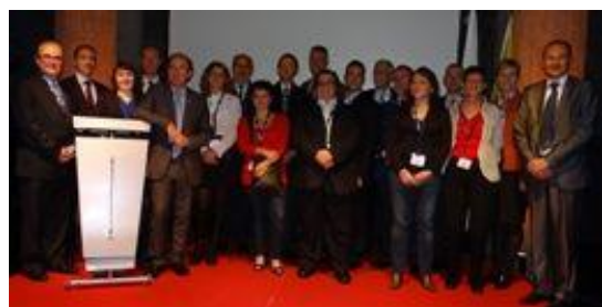
Congrès international en Mons, Belgique