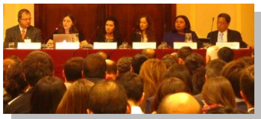
Séminaire international à Santiago, Chili

Le Sous-secrétariat de prévention du crime du Ministère de l'intérieur et de la Sécurité publique du Chili et l'agence de coopération internationale ont organisé le 24 octobre 2013, le Séminaire International « La prévention du crime et ses bonnes pratiques ». Le CIPC a été invité à présenter l'organisation et ses travaux. Avec les représentants des gouvernements du Chili, du Mexique et du Panama, de la Fondation Paz Ciudadana et du CIPC, des perspectives et expériences de ces trois pays et internationales ont été partagées avec plus d'une centaine de participants. Le CIPC a sponsorisé l'événement.