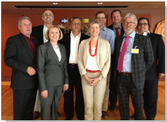
Réunions de Gouvernance du CIPC

La dix-neuvième Assemblée générale des membres (AGM) du CIPC a été convoquée à Montréal conjointement avec la mini-conférence du CIPC qui s'est tenue le 6 mai 2013 aux quartiers généraux de la Police provinciale du Québec, la Sureté du Québec.