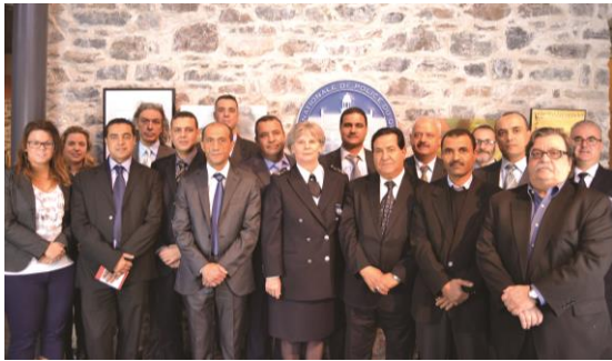
Délégation de la Tunisie à Montréal

Du 11 au 15 novembre 2013, le CIPC a reçu une délégation de Tunis (Tunisie), formée de représentants de la police, de la garde nationale, du ministère de l'intérieur et du PNUD, travaillant au projet d'appui à la Réforme du Secteur de Sécurité en Tunisie. La délégation a visité l'École nationale de police du Québec (ENPQ), la Sûreté du Québec (SQ), le Service de police de la Ville de Repentigny, le Service de police de la Ville de Montréal (SPVM) ainsi que la Gendarmerie Royale du Canada (GRC).