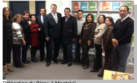
Délégation du Pérou à Montréal

Du 21 au 25 octobre 2013, le CIPC a reçu une délégation du Pérou travaillant sur le projet Stratégies locales intégrées pour la prévention de la violence contre les femmes et les jeunes. Celle-ci comprenait des représentants de la police Nationale du Pérou, de la Municipalité des districts de Villa el Salvador et San Juan de Lurigancho, des représentantes de femmes leader et de notre principal partenaire, Flora Tristan. Leur visite leur a permis d'échanger sur les pratiques de prévention au Canada.