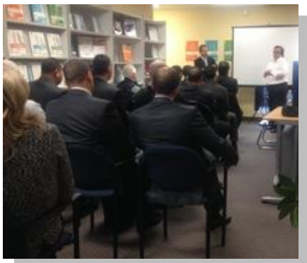
Mini-conférence du CIPC