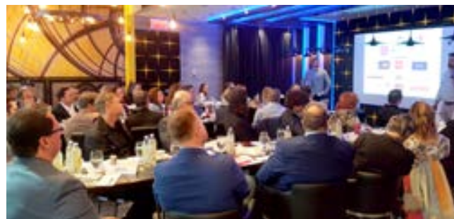
Le 12 juin 2018, le Resto-Bar Le Commandant, à Québec, a accueilli la première édition des Cafés-Conférences. Il a été question de l'optimisation de la performance des établissements de restauration.