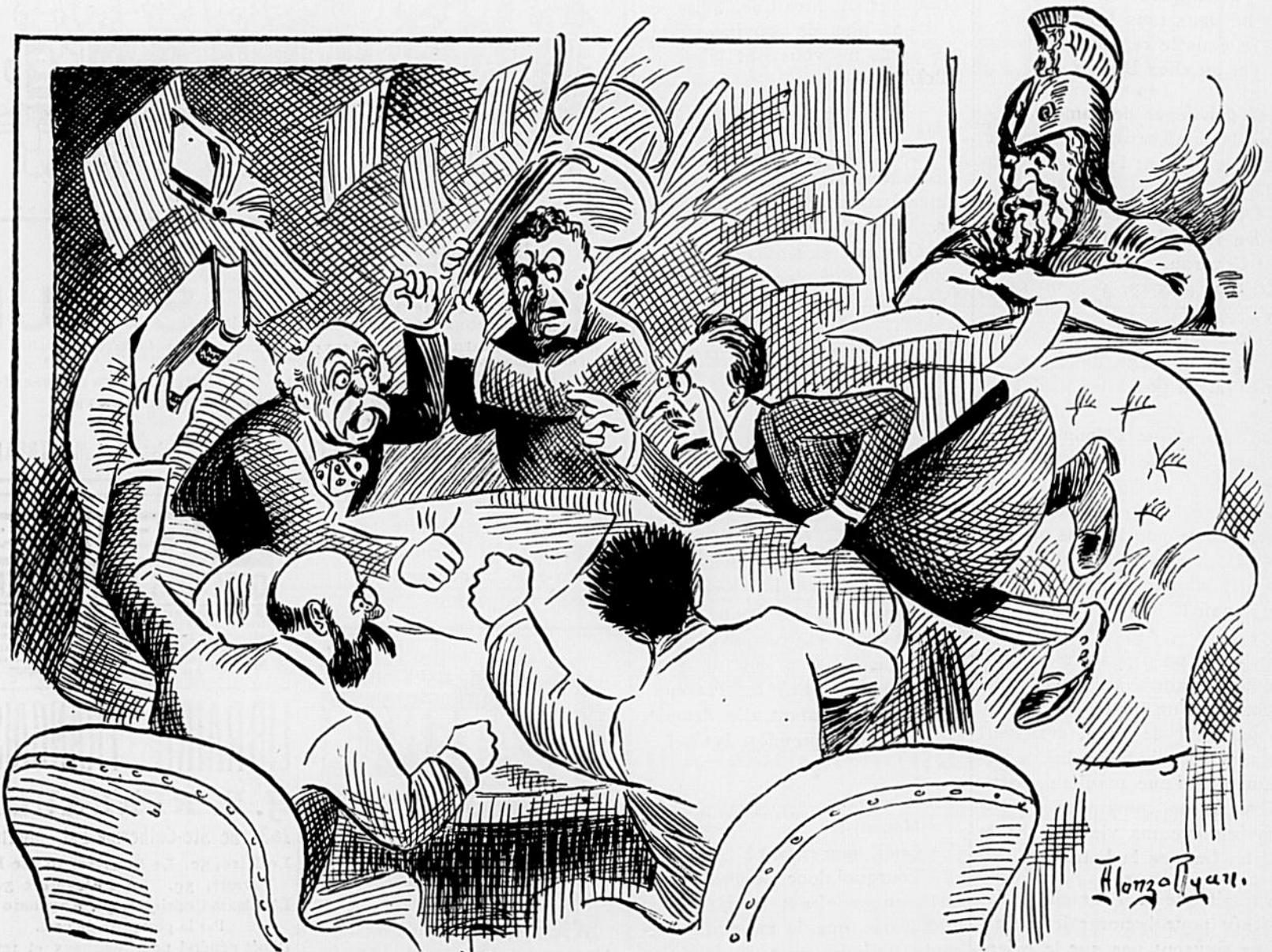
COMMENT A LA HAYE ON PREPARE LA PAIX! "SI VIS PACEM."