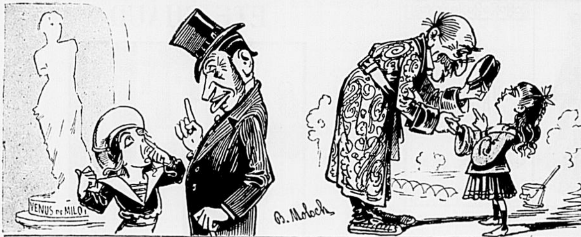
— Dis, pourquoi qu'on lui a coupé les bras à la Dame? — Parce qu'elle fourrait toujours ses doigts dans son nez!

M. Valhubert, l'artiste bien-aimé, est rentré d'une villégiature